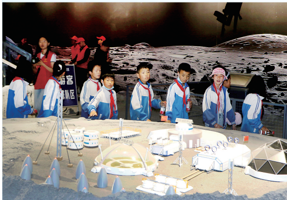
松鸣岩大中小学劳动教育综合实践基地研学游