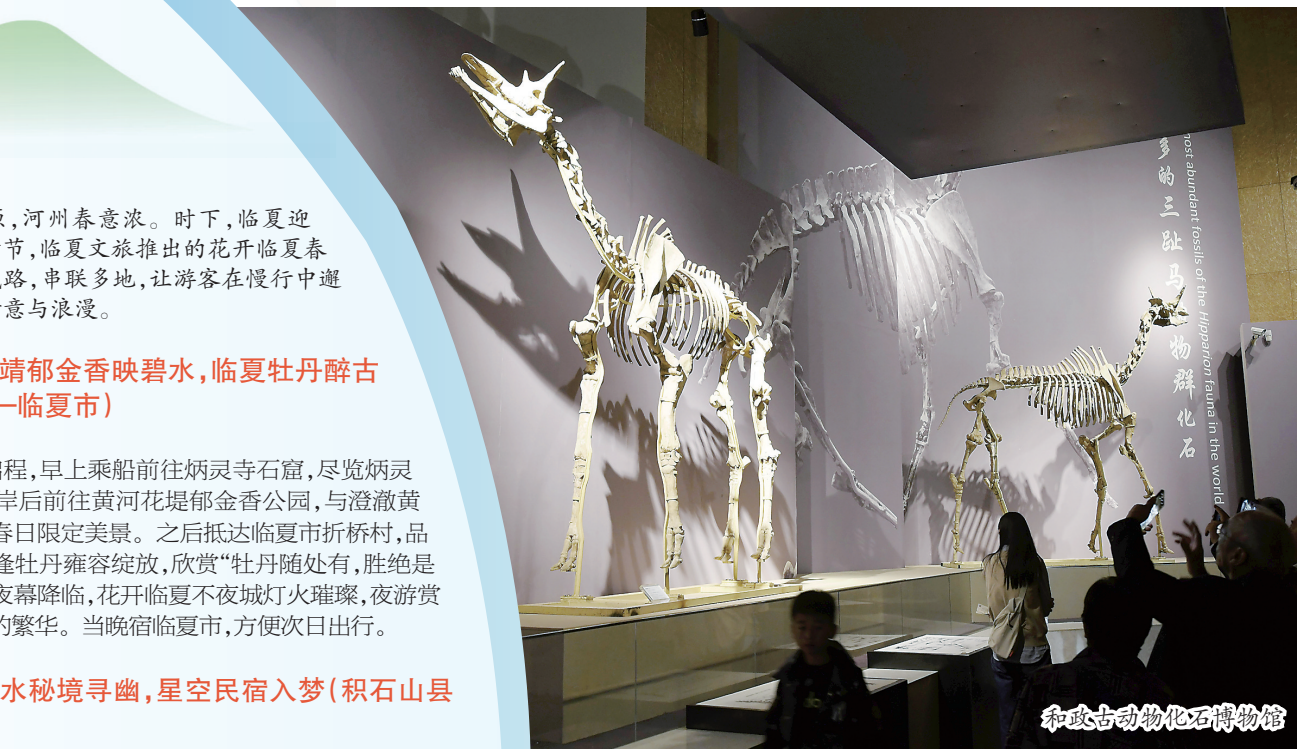
和政古动物化石博物馆