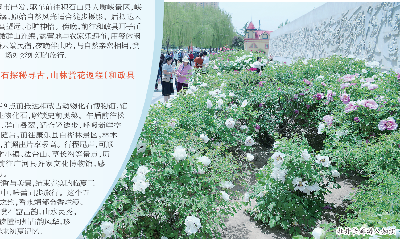
牡丹长廊游人如织