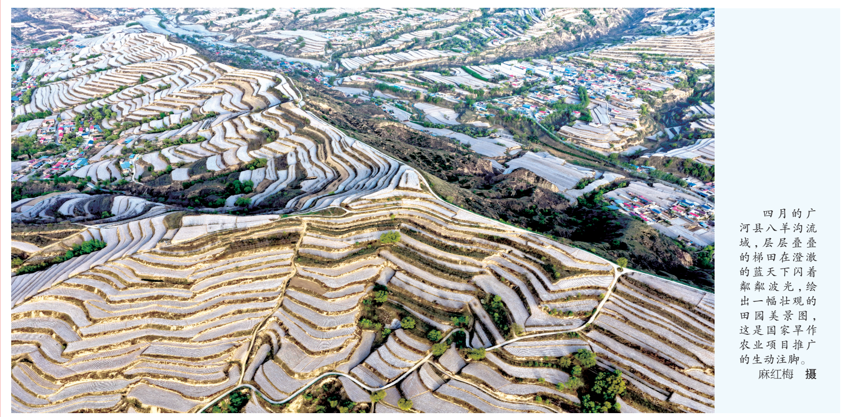
四月的广河县八羊沟流域,层层叠叠的梯田在澄澈的蓝天下闪着粼粼波光,绘出一幅壮观的田园美景图,这是国家旱作农业项目推广的生动注脚。