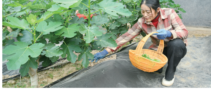
临夏市欣农无花果采摘园建有温棚9座,园内种植波姬红、芭乐奈、金傲芬、斯特拉等6个优质无花果品种。眼下,园内无花果树长势喜人,果实饱满挂枝,呈现出良好的生长态势。

此次活动以书法与太极为载体,将传统文化融入校园日常,丰富了乡村孩子的课余时间,让青少年在实践中强健体魄、传承文化。现场师生互动热烈、氛围浓厚,助力中华优秀传统文化在乡村校园落地生根、焕发新生机。