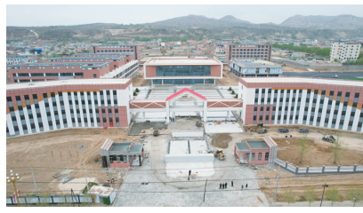
高中学位紧缺的难题。

相较于三甲集移民中学的有序收尾,广河县实验中学建设现场更“抢工期、抓质量”的强劲势头。操场区域,挖掘机开挖地基,轮廓日渐清晰;教学楼旁,塔吊不停运转,工人们穿梭忙碌;外墙施工区域,工人专注抹灰作业,教学楼外观愈发规整。该项目总投资1.5亿元,分三期建设,建成后设置45个教学班,新增学位2250个,进一步破解