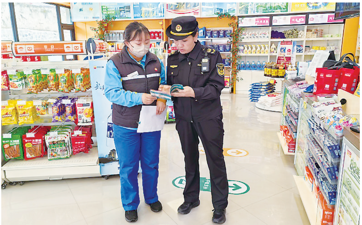
连日来,东乡县应急管理局组织工作人员深入辖区部分加油站,开展社会信用体系建设宣传活动,通过发放宣传资料、结合典型案例以案释法等方式,引导企业自觉抵制失信行为,助力营造诚实守信的良好社会氛围。

“两所学校建成后,将新增学位4250个,有效解决县城高中学位不足及三甲集镇初中“大校额、大班额”等问题。”该县教育局党组成员马志林表示,这两个项目是县委、县政府践行教育强县战略、办好民生实事的具体体现,将进一步优化教育资源布局、提升县域办学水平,为广河县教育高质量发展注入强劲动力。