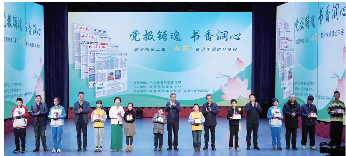
临夏州第二届“小荷”青少年阅读分享会