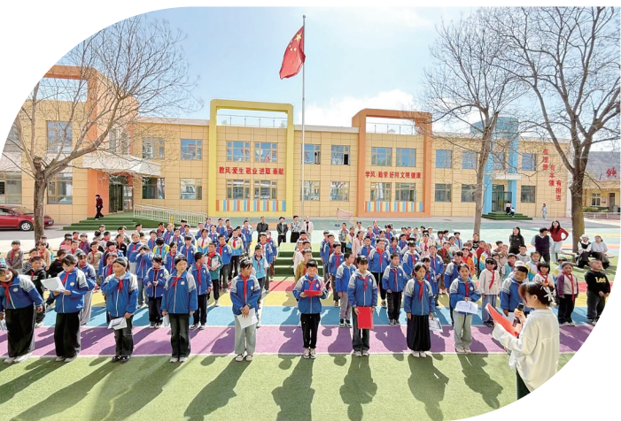
全民阅读推广进校园