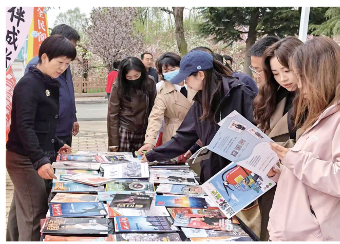
“借一城花开·许万卷漂流”全民阅读分享活动