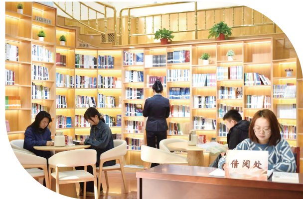
高品质阅读示范点