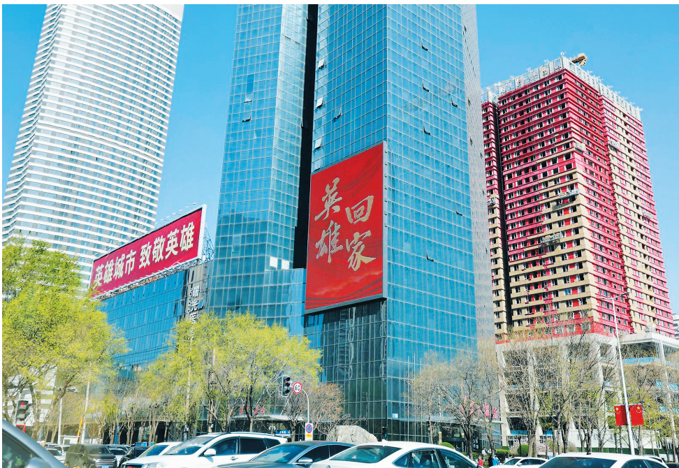
4月21日拍摄的沈阳街头的标语。第十三批在韩中国人民志愿军烈士遗骸将于4月22日回国。沈阳市以最高礼遇迎接英雄归来,热烈“中国红”为英雄照亮回家路。

志愿服务对凝聚服务群众具有天然亲和力,志愿者具有扎根基层、源于群众、联络各方的先天优势。中央社会工作部志愿服务促进中心主任娄华锋介绍,“专业社工+志愿服务”融合试点工作开展以来,新成立各类志愿服务队伍794支;新实施各类志愿服务项目2463个,其中矛盾纠纷排查化解类志愿服务项目505个。