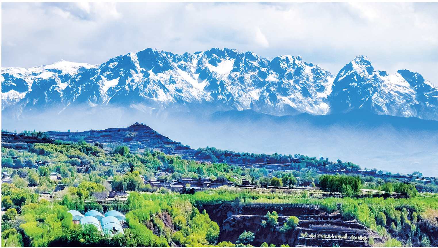
四月春光正好,远眺太子山,山顶白雪皑皑,山下绿树花开,风景如画。