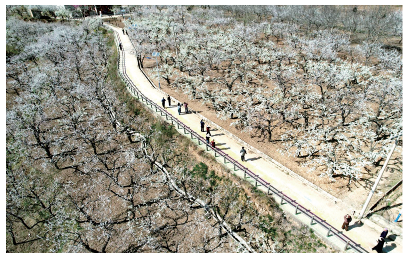
时下,临夏县河西乡的梨园里梨花盛放,如雪似雾,引得不少游客前来踏青赏花,沉浸式感受田园野趣。

工作的缩影。在村级层面,庄窠集镇大庄村村干部主动担当,落实各项防控措施,形成“护林员守山头、村干部抓统筹”的工作格局,织密村级森林防火安全网。 进入春季防火期以来,该县进一步压实各级责任,强化火源管控,严格落实进山登记、火种收缴等措施。同时加大宣传力度,通过入户宣讲、悬挂标语、大喇叭播报等形式,提升群众防火意识,营造“护林防火 人人有责”的浓厚氛围。通过凝聚多方合力,坚决守住森林防火底线,守护好森林资源和生态家园,持续筑牢县域生态安全屏障。