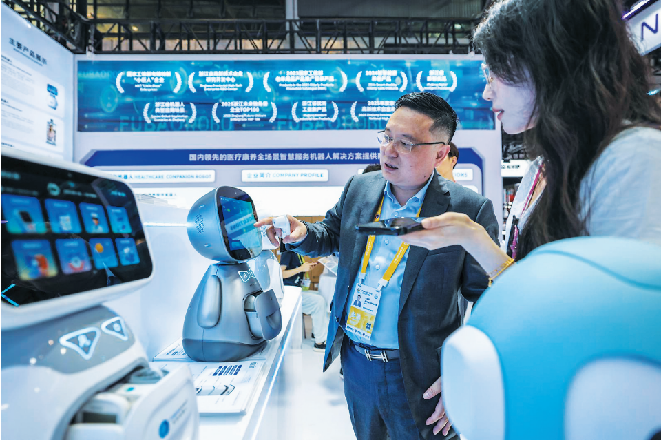
4月13日,参观者在第六届消博会主会场了解智能机器人产品。 4月13日,第六届中国国际消费品博览会在海南举办。本届展会是海南自贸港全岛封关运作后的首届国家级消费盛会,以“开放引领全球消费,创新驱动美好生活”为主题,汇聚了来自60多个国家和地区的超过3400个品牌参展,搭建起全球消费精品展示交易的国际化平台。

4月13日,在江苏省扬州市公安局江都分局出入境管理大队,扬州市江都区一幼儿园的小朋友通过与机器人对话了解出入境安全知识。 今年4月15日是第十一个全民国家安全教育日,活动主题为“统筹发展和安全 护航‘十五五’新征程”。各地开展形式多样的主题宣传教育活动,提高人们的安全意识。