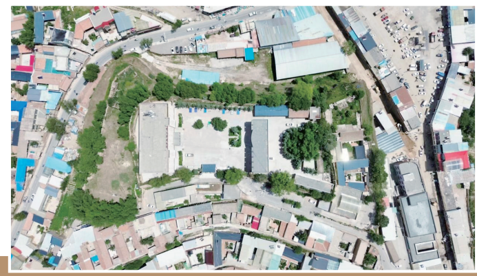
锁南坝寨堡俯视图

从某种意义上讲,有一类作品,往往是作者“心灵的自传”。我认为正邦的书法是这样:我一向读书,感兴趣的不仅仅是作者写了什么,而更感兴趣的是要读出作品中作者的情怀,体味弦外之音,理解作者的精神与性情,风神与风采,气息和气质。这就是我对《中国近现代名家书法集》每幅作品的每个字,处处活跃地表现正邦的“自我”。很显然,这个“自我”,绝不是替身,这是几十年心血凝成的结晶,也绝不会是“假唱”,是发自灵魂深处的心声。于是我读出了它背后的那位勤恳认真、坚韧而执着的正邦,读出了那位沉稳宽厚、慎言而诚谨的正邦,读出了那位朴实至善、胸中仍然熊熊燃烧着中国文化火焰的正邦。