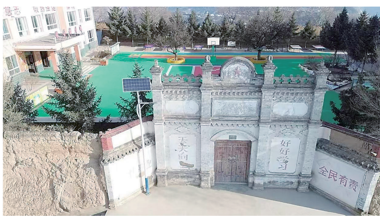
民国时期修建的导河县第二区第二高级小学校门

今日的锁南坝,不仅仅属于地理学的范畴,还包含了民族融合、历史沿革、社会变革、时代发展、民俗风情、人文传承等十分丰富的内容。