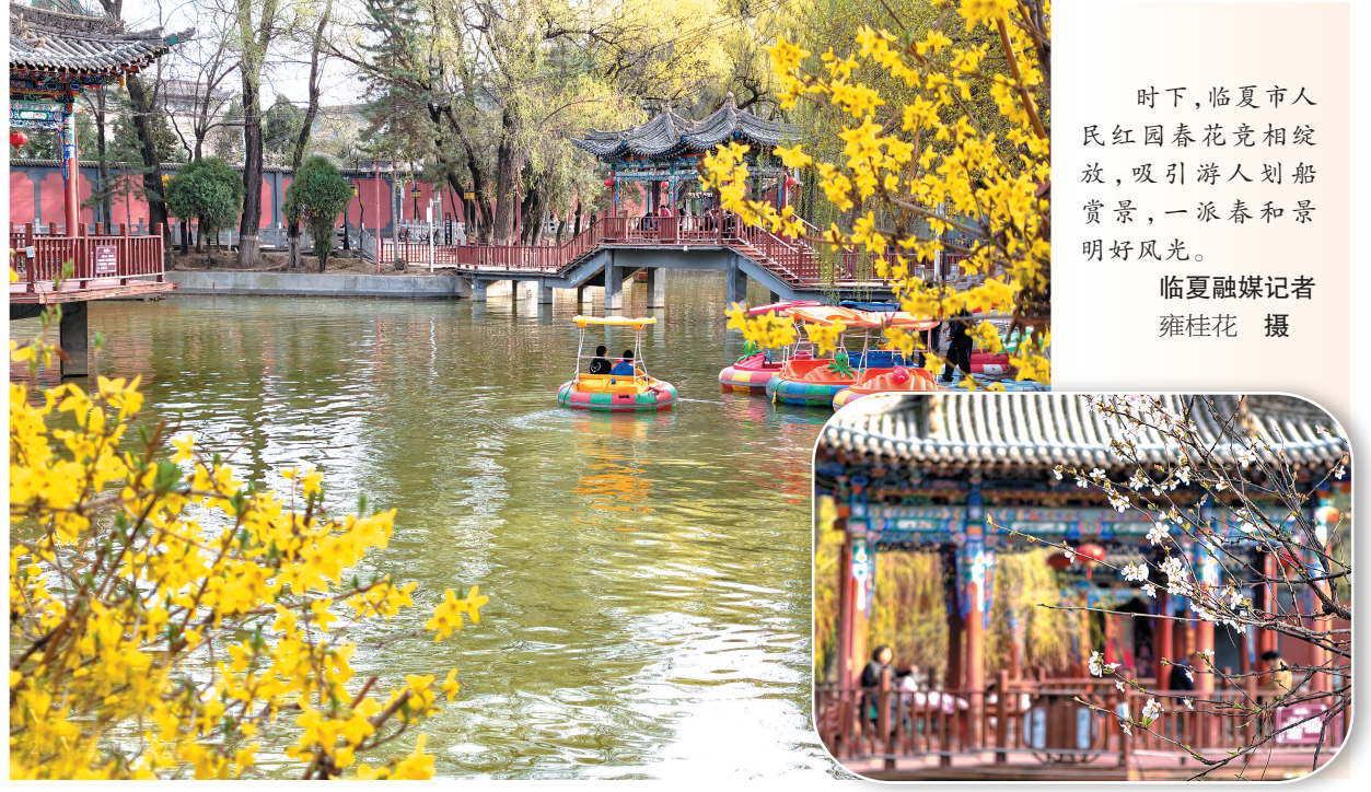
时下,临夏市人民红园春花竞相绽放,吸引游人划船赏景,一派春和景明好风光。