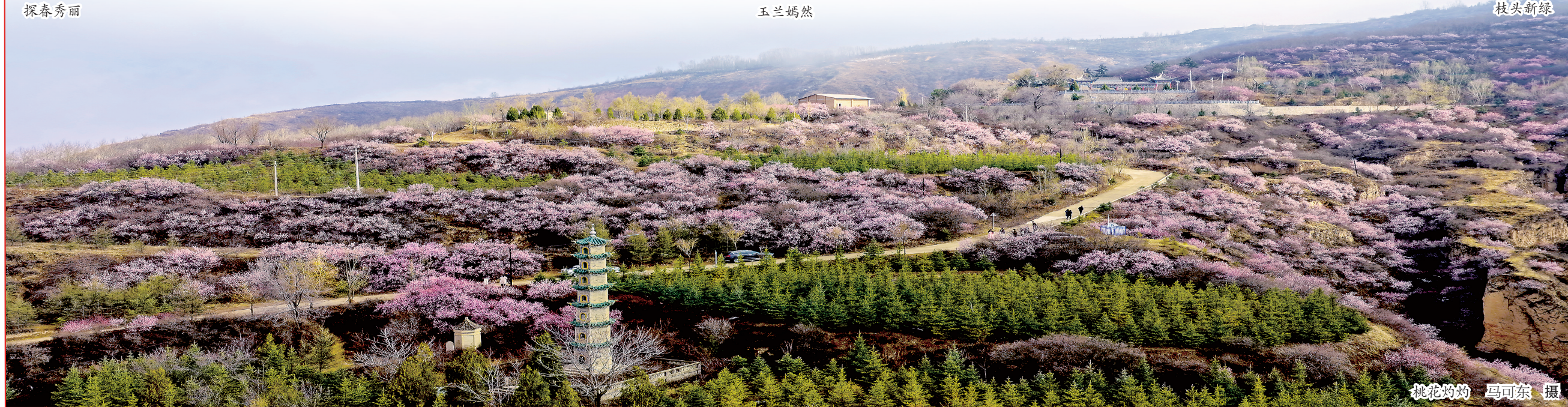
桃花灼灼