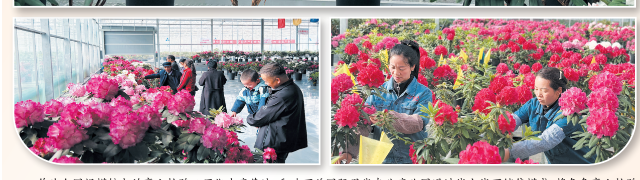
作为全国规模较大的高山杜鹃工厂化生产基地,和政百益国际现代农业产业园通过线上线下销售模式,将各色高山杜鹃销往全国各地,为当地群众提供近200个稳定岗位。图为3月30日,人们在基地赏花选购、工作人员修剪培育花卉。