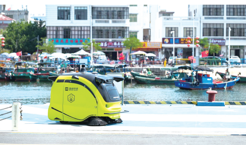
日前,海南省以琼海市博鳌镇为试点,推进首批智慧环卫示范建设。智慧环卫设施在博鳌亚洲论坛2026年年会期间集中亮相,以精准调度、快速处置、高标准保障的表现,成为论坛城市服务保障的亮点成果。

新华社南京3月26日电 (记者冯家顺 朱国亮)记者3月26日从国家安全部获悉,全国首个以科技安全为主题的全国国家安全教育基地日前在江苏南京开馆。 据悉,基地以“铸科技之盾 强安全之基”为主题,系统阐释总体国家安全观的核心要义,突出科技安全在国家安全体系中的战略地位,旨在通过沉浸式教育凝聚全社会维护科技安全的共识。展馆分为“国家安全 复兴之基”“大