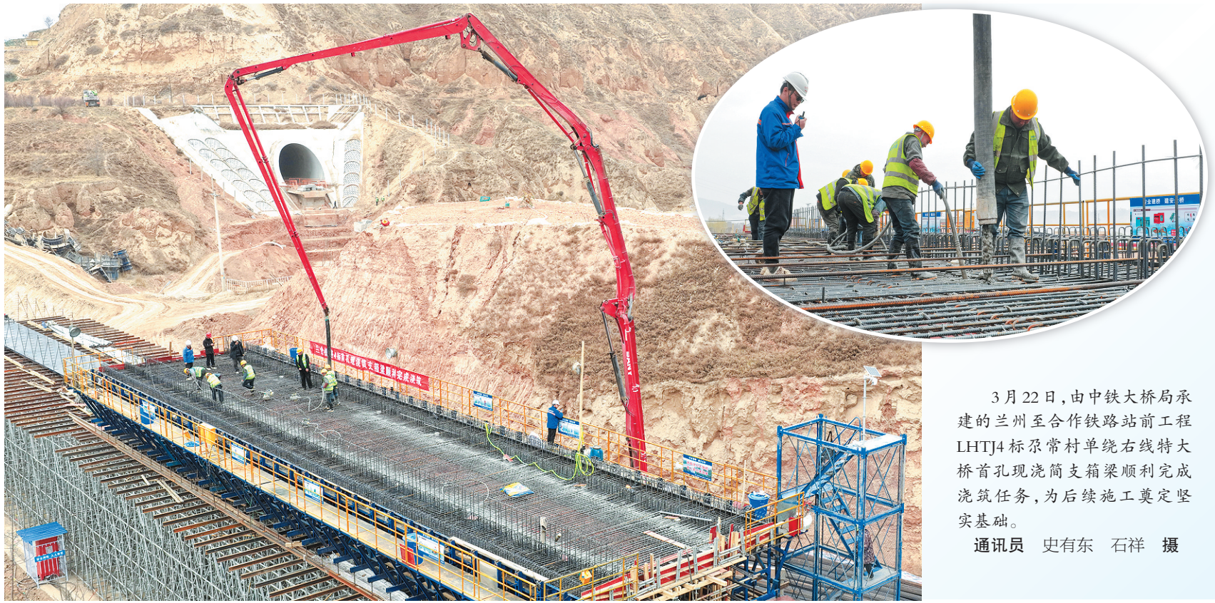
3月22日，由中铁大桥局承建的兰州至合作铁路站前工程LHTJ4标常村单绕右线特大桥首孔现浇筒支箱梁顺利完成浇筑任务，为后续施工奠定坚实基础。