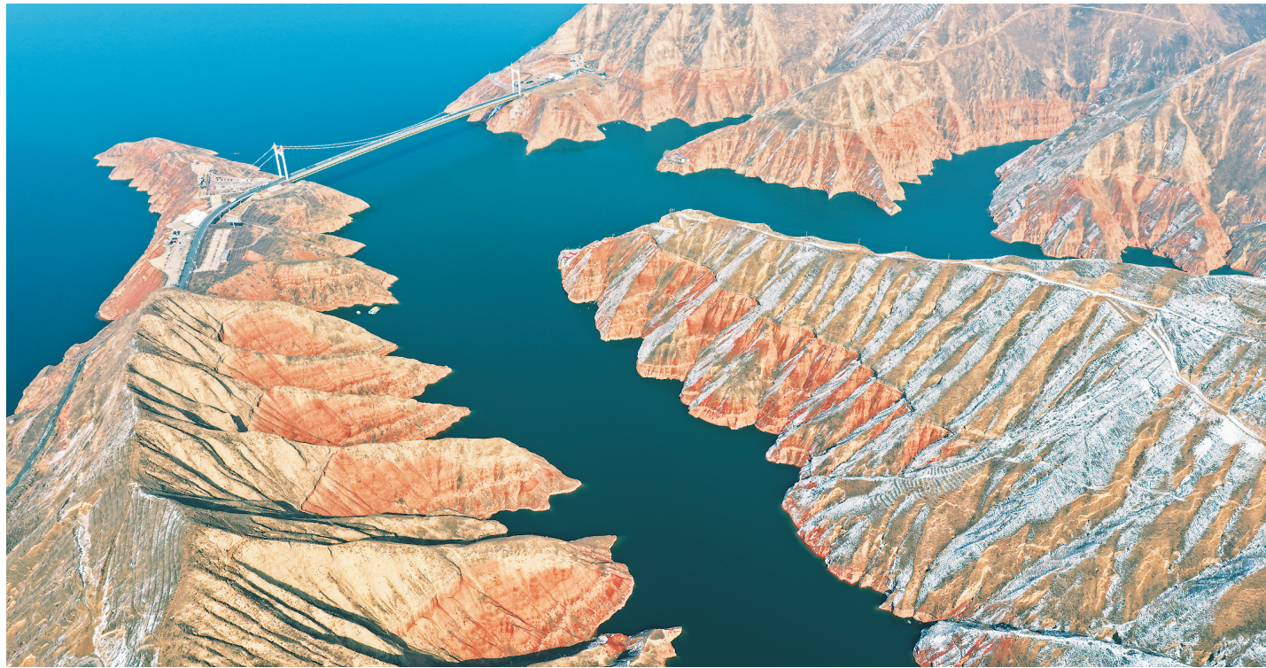
春日,位于东乡县考察地段的奔跑沟景区,丹霞地貌与碧绿的刘家峡水库相互映衬,勾勒出一幅美丽的山水画卷。

尽好奇……青春的热情与创意点亮了孩子们眼中的星光。 自2026年度“返家乡”大学生社会实践活动启动以来,全州各级团组织积极响应,广泛动员、搭建平台,引导大学生深入基层、了解家乡,将所学知识与实践相结合,为家乡发展贡献智慧与力量。(转2版)