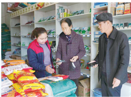
▲当前正值春耕备耕关键时期，永靖县早谋划、早部署、早储备，统筹推进种子、化肥等农资储备工作，以充足储备、优质供给，保障春耕农业生产“第一棒”。图为农户在农资企业采购有机化肥和农药及种子。