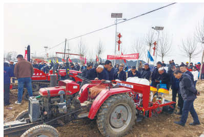
本报讯（临夏融媒记者 张原厂）3月23日，临夏州2026年春耕备耕

春日的临夏县，沃野平畴生机勃勃。标准化牛舍里，肉牛膘肥体健；日光温室中，时鲜蔬菜青翠欲滴。近年来，临夏县立足农牧交错带资源禀赋，锚定乡村振兴总目标，以全产业链思维做强“一头牛”畜牧主导产业、做优“一棵菜”特色种植产业，通过种养循环、延链补链、联农带农，走出一条产业兴旺、群众增收、生态宜居的高质量发展新路，让特色产业成为撬动乡村振兴的强力杠杆。