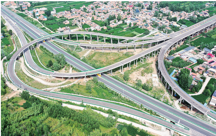
临夏双城至达里加(甘青界)一级公路