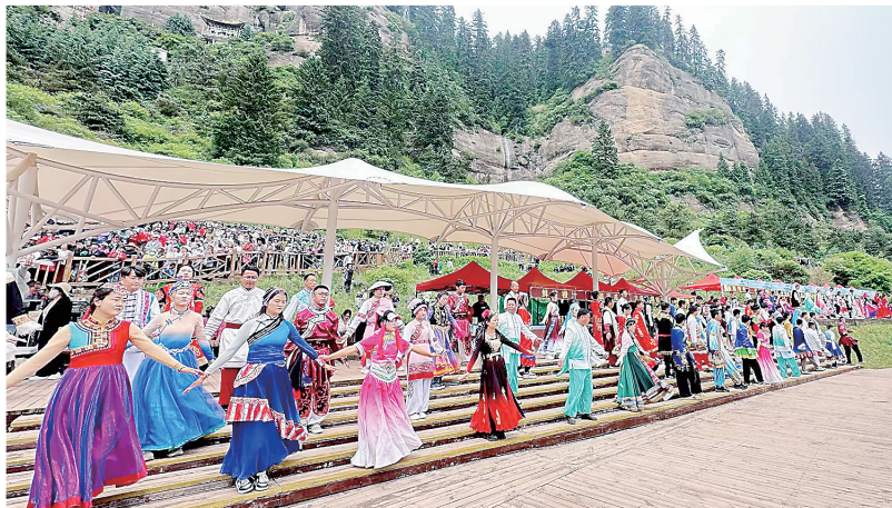
各族人民共唱团结曲