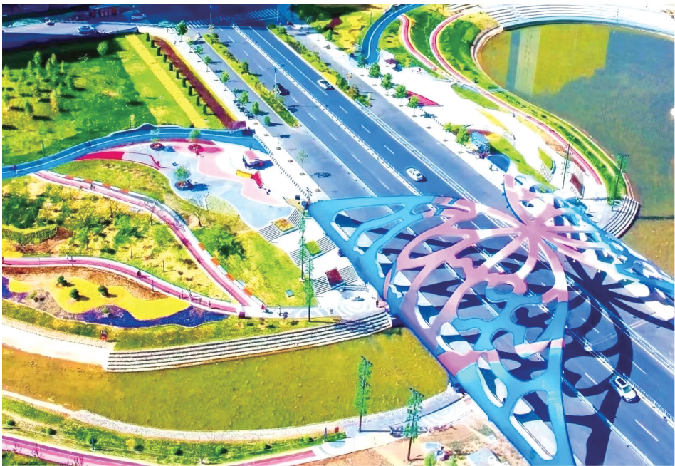
黄河国家文化公园—河州牡丹文化公园