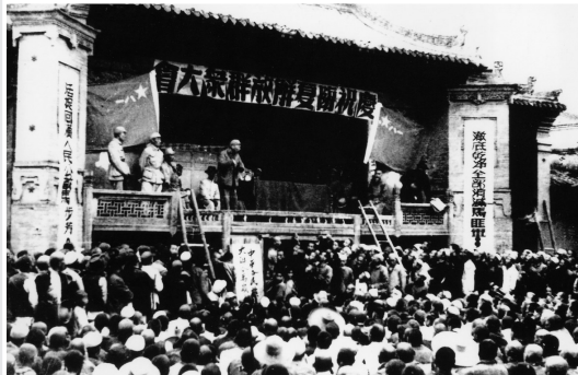
庆祝临夏解放群众大会现场

共同体意识,像石榴籽一样紧紧抱在一起,共同开发建设,共同守护家园。文化的多样性在这里交相辉映,凝聚起促进发展、维护稳定的强大合力。社会各界无私的帮助与支持,如涓涓细流,汇成了支持临夏前行的磅礴力量。 大河奔流,见证沧桑巨变;初心如磐,续写时代华章。69年,是时间的刻度,更是奋斗的见证。从温饱不足到幸福洋溢,从山河依旧到万象更新,临夏的每一步跨越,都彰显着中国特色社会主义制度的巨大优越性,凝结着每一个奋斗者的智慧与汗水。69年是里程碑,更是新起点。站在新的起点,临夏各族儿女必将牢记嘱托、感恩奋进,以更加自信的姿态、更加坚定的步伐,在全面建设社会主义现代化的伟大征程中,继续书写属于临夏的辉煌篇章。