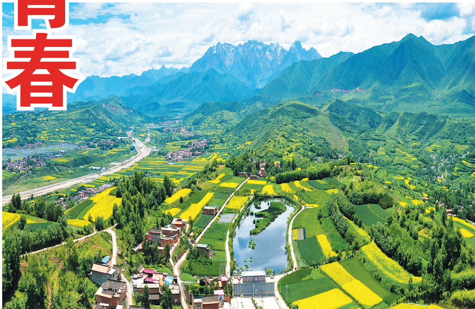
和美乡村临夏县围场村