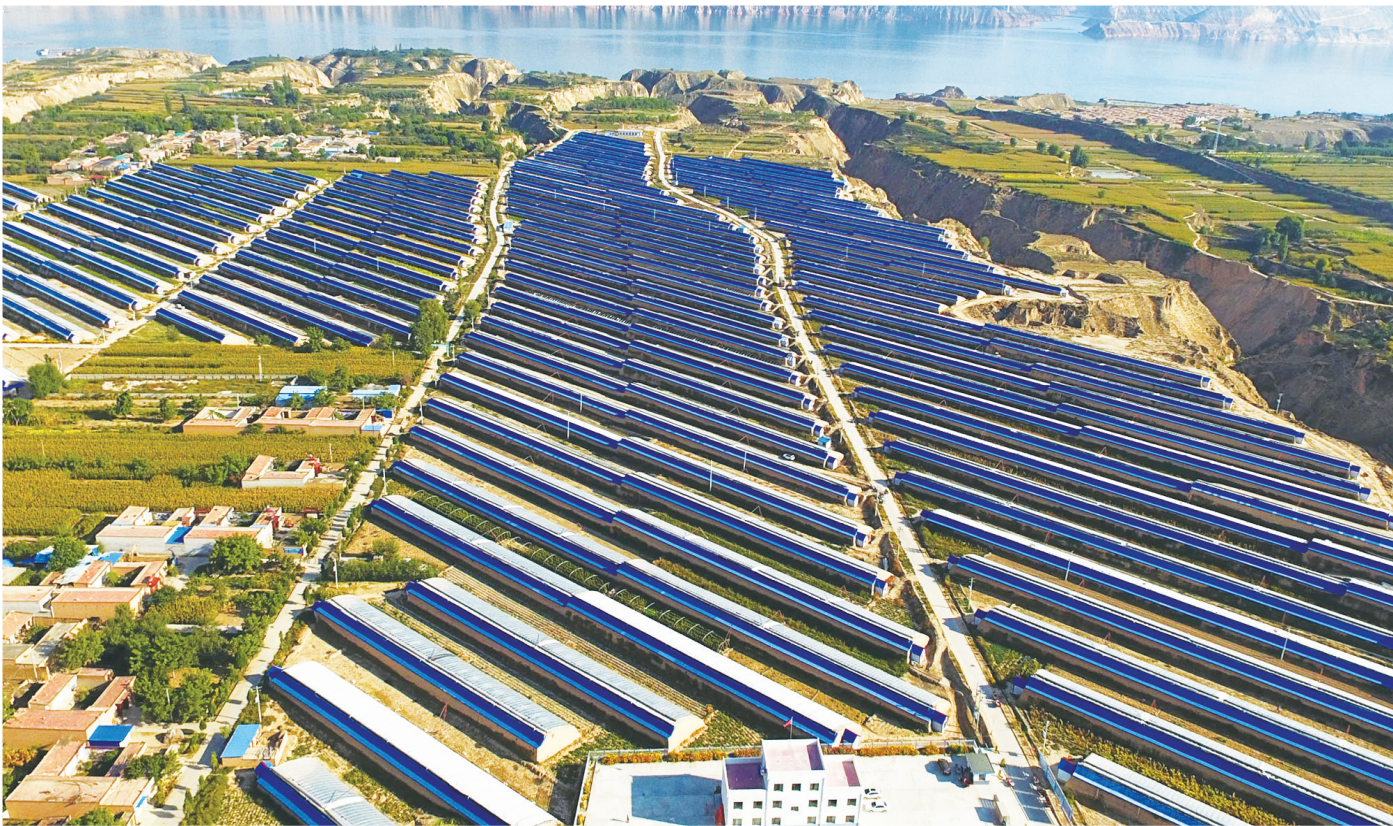
现代农业助力乡村振兴