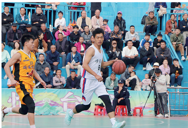
临夏州篮球队闪耀“村BA”舞台