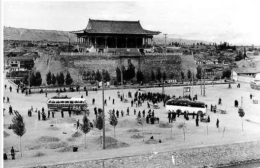
上世纪50年代的临夏南城門