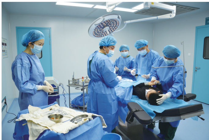
优质医疗惠及基层