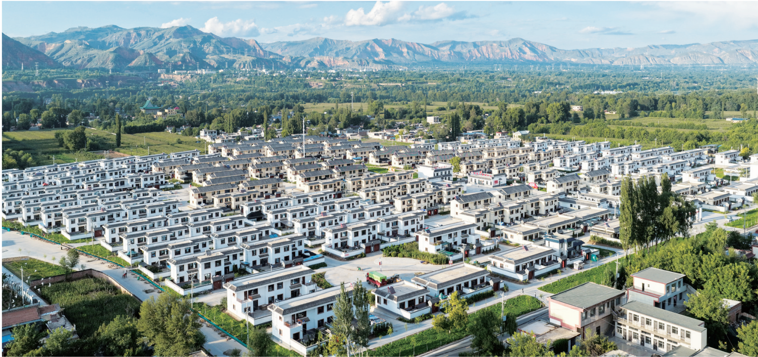
积石山县大河家镇四堡子新村

69载岁月如歌,69年春华秋实。当历史的车轮行进至11月19日,临夏回族自治州迎来了成立69周年的荣光时刻。在这个喜庆而美好的日子里,我们真挚祝福——临夏生日快乐! 69年前的11月19日,经国务院批准临夏回族自治州成立,开启了全州各项事业发展的新纪元。回望这段跨世纪的征程,一幅在党中央、国务院的亲切关怀,省委、省政府的坚强领导,社会各界的鼎力相助下,州委、州政府团结带领全州各族干部群众携手拼搏的壮丽画卷,在这片充满活力的土地上徐徐展开,焕发着翻天覆地的时代光彩。 这是深情关怀浸润山河的69年。从脱贫攻坚的精准滴灌到乡村振兴的宏图画卷,从一项惠民政策的春风到一批批重大基础设施项