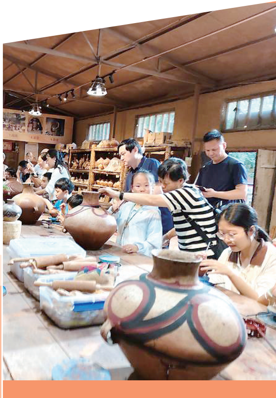
林家彩陶文化传承发展基地