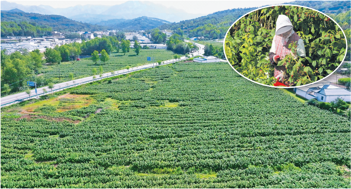
近日,和政县罗家集镇千亩红树莓迎来成熟季,工作人员穿梭在田垄间采摘鲜果,田间地头洋溢着丰收的喜悦。