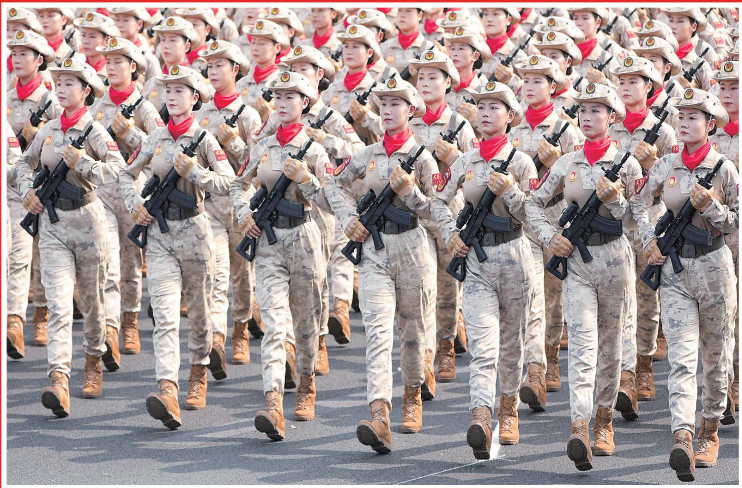
民兵方队接受检阅