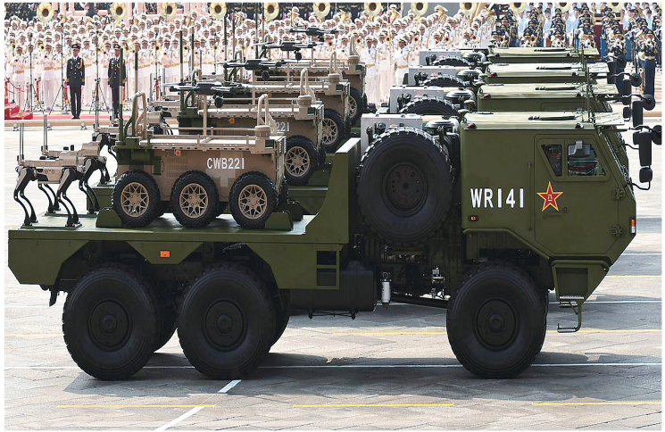
陆上无人作战方队接受检阅