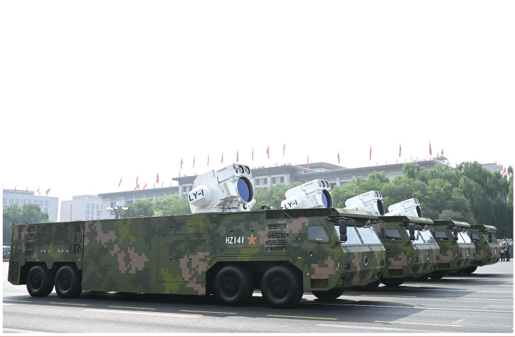
舰载防空武器方队接受检阅