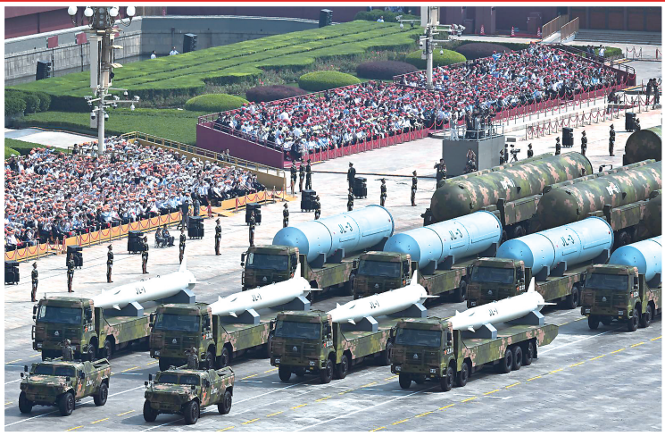
核导弹第一方队接受检阅