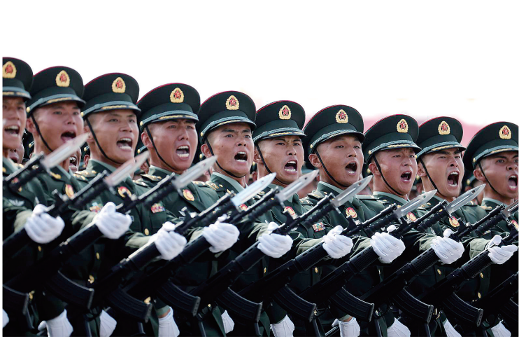
陆军方队接受检阅