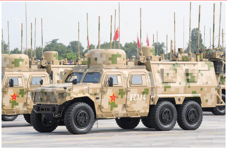
信息支援方队接受检阅