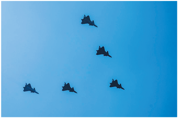
歼击机梯队接受检阅