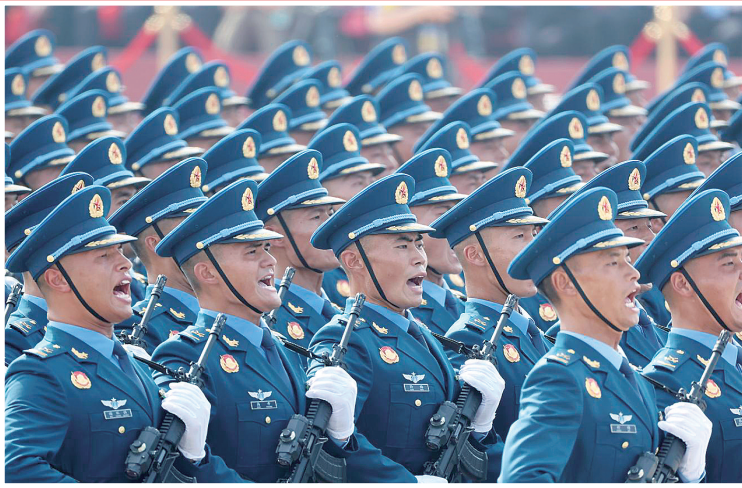
空军方队接受检阅