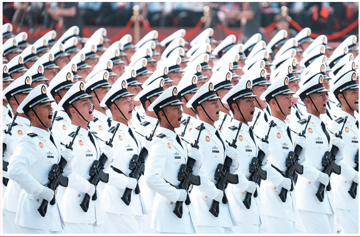
海军方队接受检阅