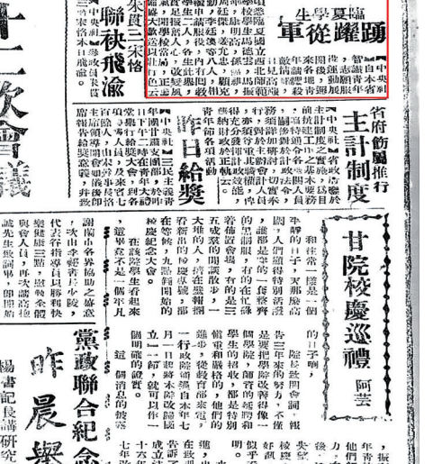
《甘肃民国日报》1944年4月4日第3版。

际交通大动脉被日军截断,沿海港口被日海军封锁,作为战时陪都和抗战后方力的重庆,战略物资特别是汽油十分紧缺,玉门油矿是当时最重要的石油生产基地。以河州各民族筏子客为主的甘肃羊皮筏子水运队雇佣20多名筏子客,用羊皮胎2000多个,在广元编组成5个大羊皮筏子,将玉门油田生产的6吨汽油,通过从广元到重庆1400多公里的嘉陵江航线成功运输到重庆,当羊皮筏子抵达重庆码头时,引起了当地巨大的轰动,玉门油矿局为此举行了盛大的“欢迎羊皮筏子航运大会”,并摄制电影纪录片作为纪念。为了满足群众的好奇心,重庆当局还将皮筏在化龙桥码头停放一段时间,供市民参观,也成就了一段“羊皮筏子赛军舰”的不朽传奇。