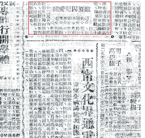
《甘肃民国日报》1939年10月17日第3版。

临夏筏运还为抗日战争作出过贡献。1941年底,抗日战争进入相持阶段后期。由于西南部