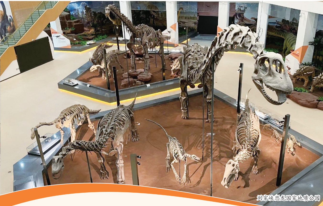
刘家峡恐龙国家地质公园