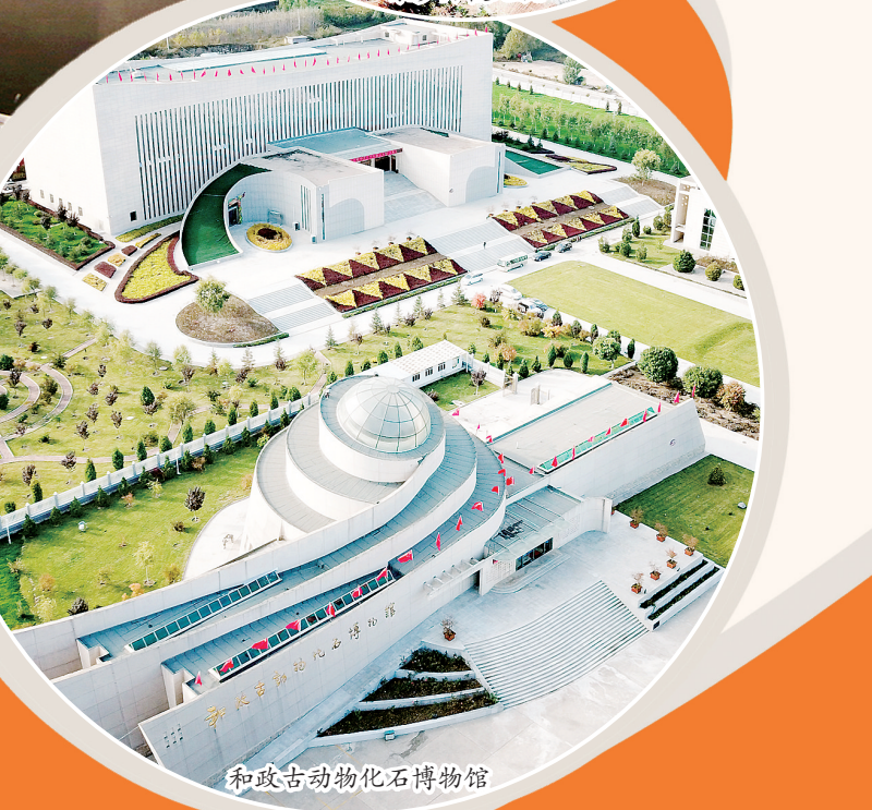
和政古动物化石博物馆