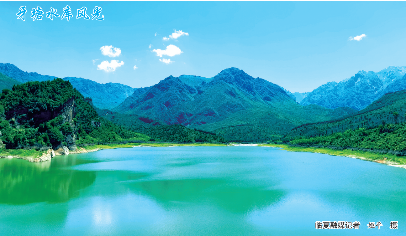
牙塘水库风光

本报讯（临夏融媒记者 马博文）7月29日上午，州委副书记、州长海东在永靖县调研永井高速公路建设和安全施工情况。州委常委、常务副州长毛鸿博，副州长杨志军参加。 海东沿永井高速公路路线型，先后来到永靖县隧道出口、吧咪山隧道进口、洮河1号大桥等重点工程点位，察看施工进度、安全防护等工作开展情况，听取项目推进情况汇报，并现场协调解决具体困难问题。 海东强调，永井高速项目是完善我州路网结构、畅通内外大循环的重大基础工程，也是当前扩投资、稳增长的重要抓手。相关县和州直相关部门要树牢“项目为王”的意识，坚持全州一盘棋，全力支持重大项目建设，进一步抓进度、抓质量、抓安全，切实把永井高速建成发展之路、致富之路、民族团结之路。要加快建设进度，抢抓当前施工黄金期，紧扣年度建设目标任务，科学合理制定施工进度计划，配齐配足施工力量，加强全过程质量监管，全力以赴开启项目建设加速度，力争形成更多的实物工作量。要抓牢施工安全，坚持安全为要，压实行业部门监管责任、企业主体责任，评估完