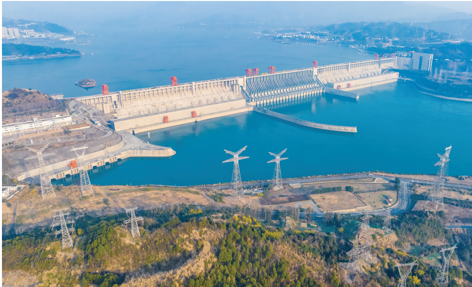
1月10日,在湖北宜昌拍摄的三峡大坝和三峡电站外输电线路(无人机照片)。