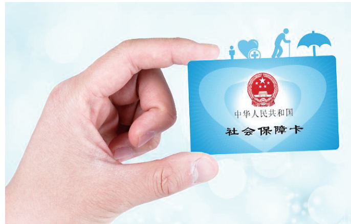
持续减轻群众就医购药负担

全国31个省份及新疆生产建设兵团将辅助生殖技术纳入医保，惠及超100万人次，为近百万个家庭的生育梦想助力；农村低收入人口等困难群众参保率达99%，医保三重保障制度累计惠及困难群众就医超1.5亿人次……新年第一天，国家医保局发布的一组数据，展现2024年医保服务新进展。