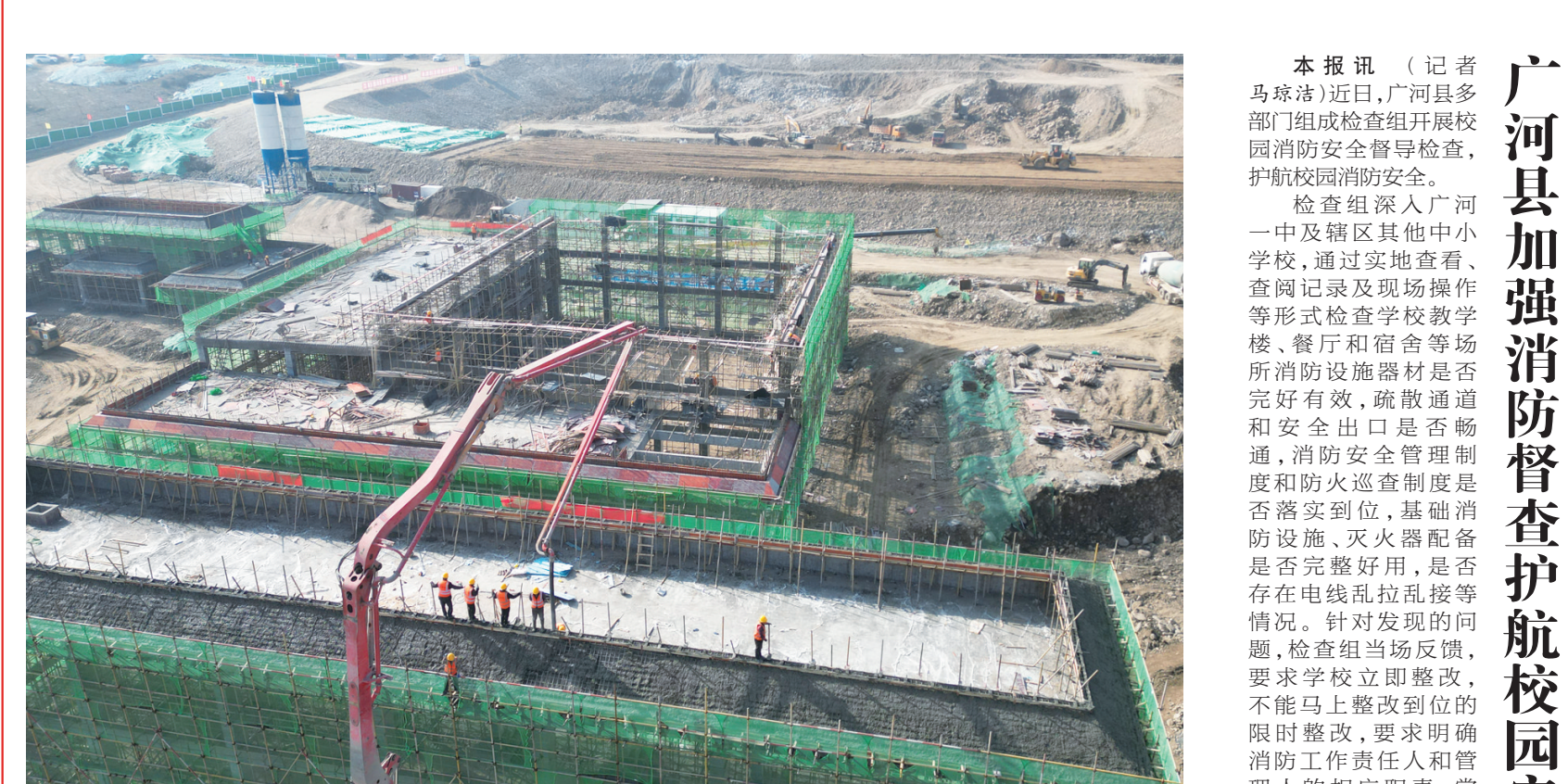
冬日时节,积石山县灾后重建供水设施配套项目施工现场一派繁忙。该项目总投资约1.02亿元,新建1座15万立方米的露天开敞式、复合土工膜防渗、钢筋混凝土面板护坡调蓄水池及1座处理能力为9000立方米/天的净水厂等,预计2025年7月底完工。