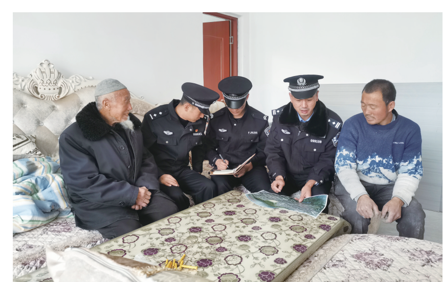
连日来,永靖县王台镇灾后恢复重建集中安置点群众有序搬进福台新村新家后,县公安局王台派出所民辅警入村采集“一标三实”标准地址信息,上门登记新入住的人口信息。

为国家通用语言,在促进教育公平、提升教学质量、加强民族团结、推动文化交流及助力社会经济发展等方面所发挥的关键作用。山东甲程教育科技有限公司负责人表达对教育事业的深情厚谊和对民族地区教育发展的高度关注。 此次捐赠的教学平台包含校园版和家庭版软件系统,为我州小学师生家长提供了普通话和规范字学习的宝贵资源。