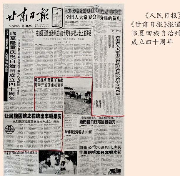
《人民日报》《甘肃日报》报道临夏回族自治州成立四十周年