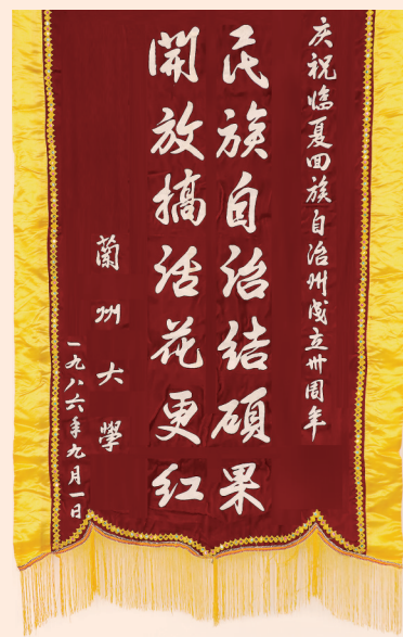
临夏回族自治州成立三十周年兰州大学赠送的锦旗