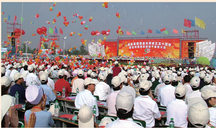
临夏回族自治州成立五十周年庆典现场