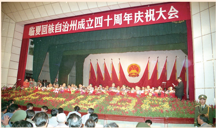
临夏回族自治州成立四十周年庆祝大会现场