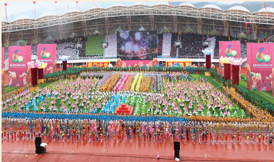
临夏回族自治州成立六十周年庆典现场