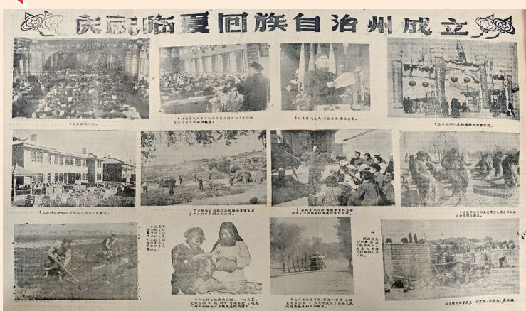
1956年，《团结报》报道临夏回族自治州成立

当前，全州上下紧盯省委赋予临夏打造全国民族团结进步示范区、全省绿色有机农畜产品生产加工基地、全省劳动密集型产业集聚地、国内知名的黄河主题旅游目的地、黄河上游生态综合治理先行地的功能定位，全力推动经济社会高质量发展。我们坚信，在党的民族政策光辉照耀下，在州委、州政府的坚强领导下，临夏各族儿女感恩奋进、勇毅前行，攻坚克难、真抓实干，必将书写中国式现代化临夏实践新篇章。