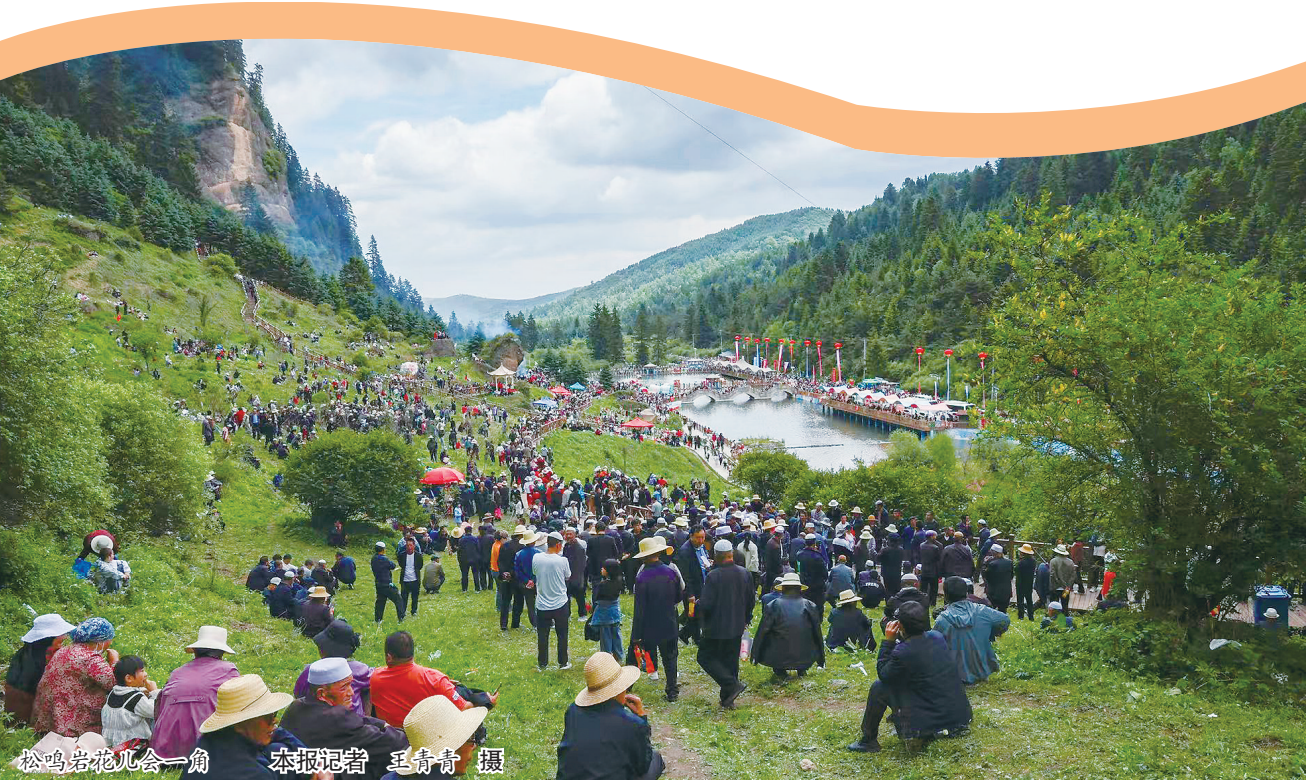
松鸣岩花儿会一角