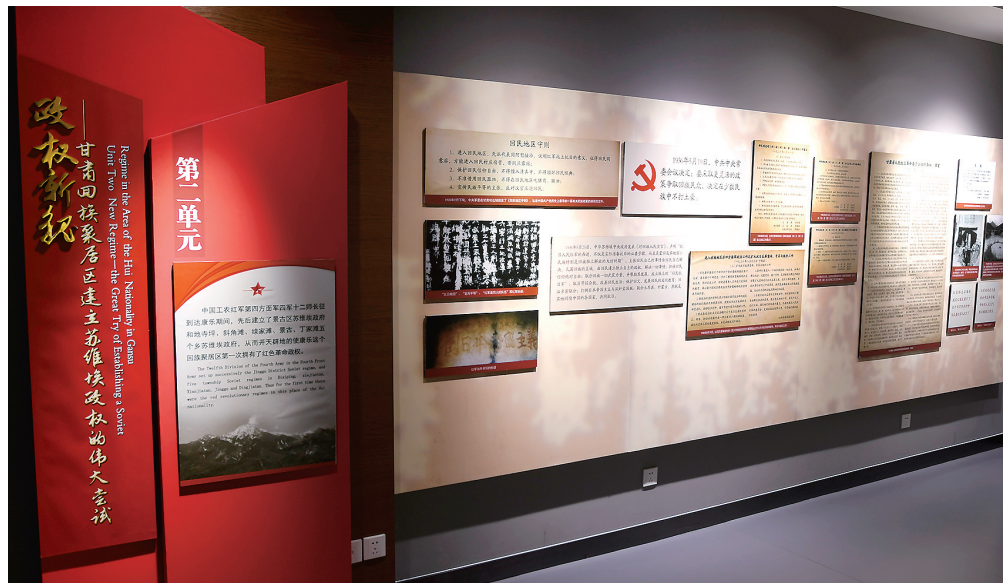
景古红色政权纪念馆

康乐县景古区苏维埃政府是当年红军在临夏建立的第一个红色政权,留下了珍贵的“红色文化”。