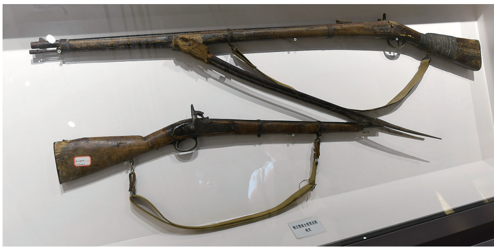
抗日义勇军独立营战士使用过的枪支