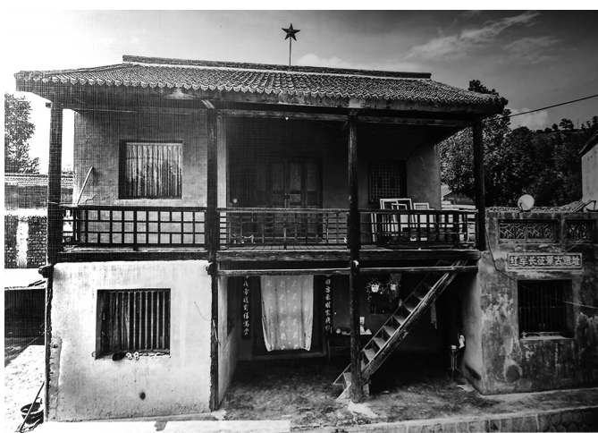
缙家楼遗址(复原照)

时至今日,康乐县仍保留着许多红军长征途中的遗迹和遗物。其中,缙家楼、石家楼等红军长征遗址已成为当地干部群众缅怀革命烈士的重要场所。而康乐县景古红色政权纪念馆的建成,更是为后人提供了一个全面了解红军在康乐地区革命活动的窗口。康乐县景古红色政权纪念馆展陈面积800平方米,馆藏革命文物73件,展品以红军长征途经康乐时的遗留物及当时驻守农户家