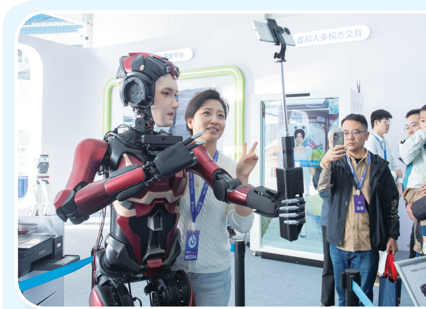
10月24日,在第七届世界声博会上,一款人形交互机器人持自拍杆与观众合影。当日,第七届世界声博会暨2024科大讯飞全球1024开发者节在合肥开幕。本届声博会为期4天,同期举办人工智能产品创新展,设置科技馆、工业馆、教育馆、生活馆等8个主题展馆。前沿人工智能技术与产品亮相展会,吸引不少观众到场参观体验,了解人工智能在工业、教育、休闲娱乐等领域的应用。

此前,经过许多地区地名管理委员会成员单位共同论证,和田县民政局正式向和田县县人民政府报批“向勇路”命名。这也是和田地区第20个红色地名。