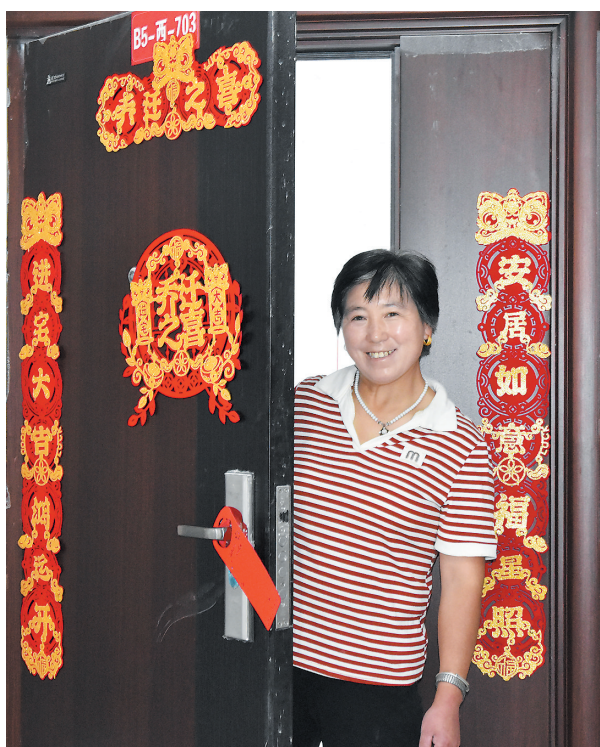
吹麻滩镇林坪村集中安置点搬迁户开门迎客