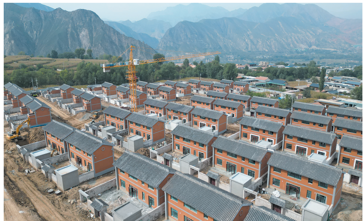
吹麻滩镇林坪村灾后恢复重建集中安置点建设项目(B地块)