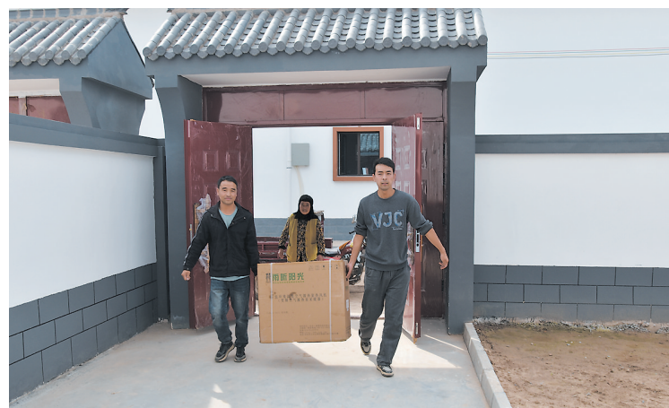
大河家镇四堡子村集中安置点群众搬迁入住