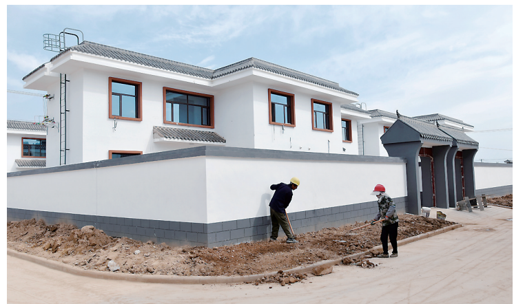
大河家镇四堡子村集中安置点工人施工作业