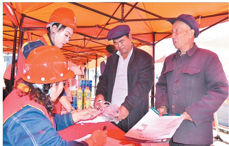
吹麻滩镇林坪村集中安置点电力部门为搬迁户办理用电手续