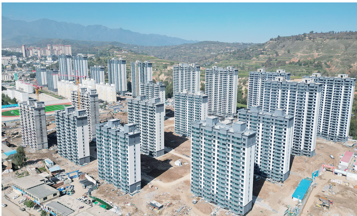
大河家镇康康吊村关门社灾后恢复重建集中安置点建设项目(A地块)