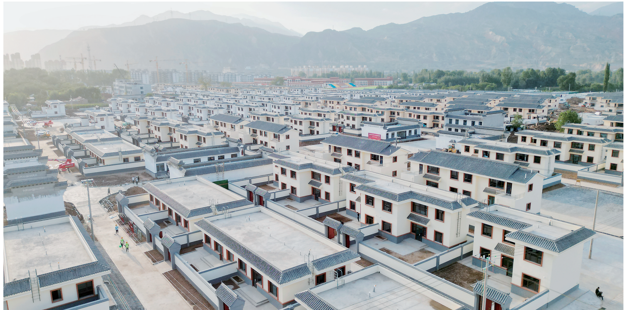
大河家镇甘河滩村灾后恢复重建集中安置点建设项目