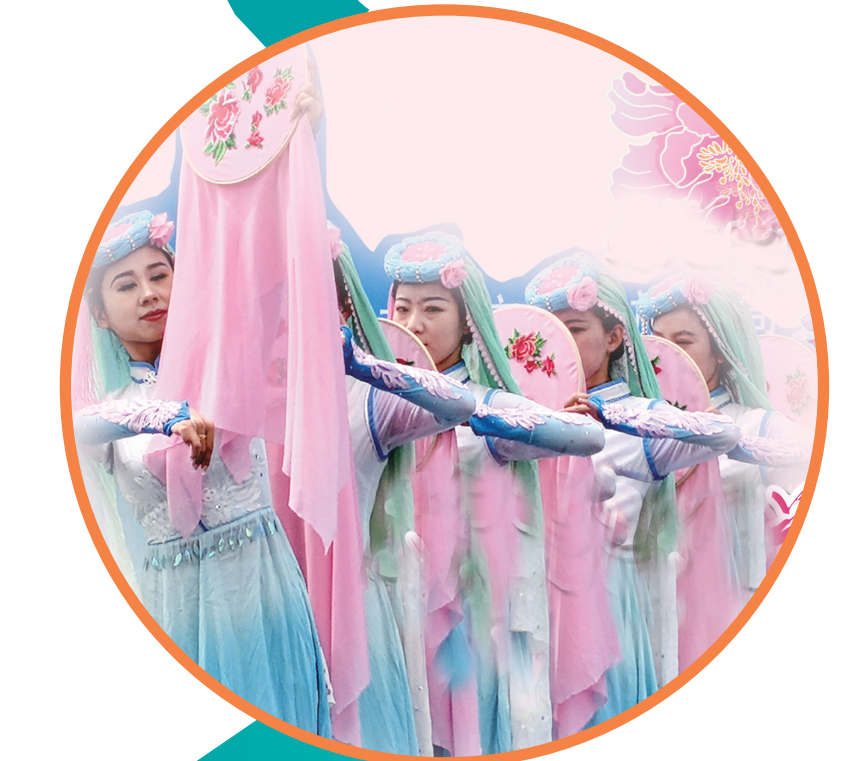
原创音舞诗剧《花儿烂漫》