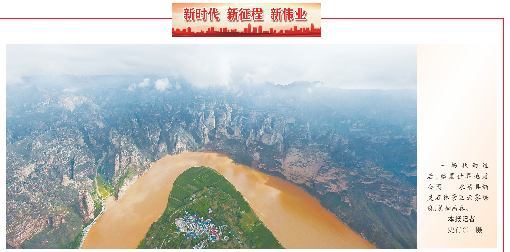
一场秋雨过后,临夏世界地质公园——永靖县炳灵石林景区云雾缭绕,美如画卷。