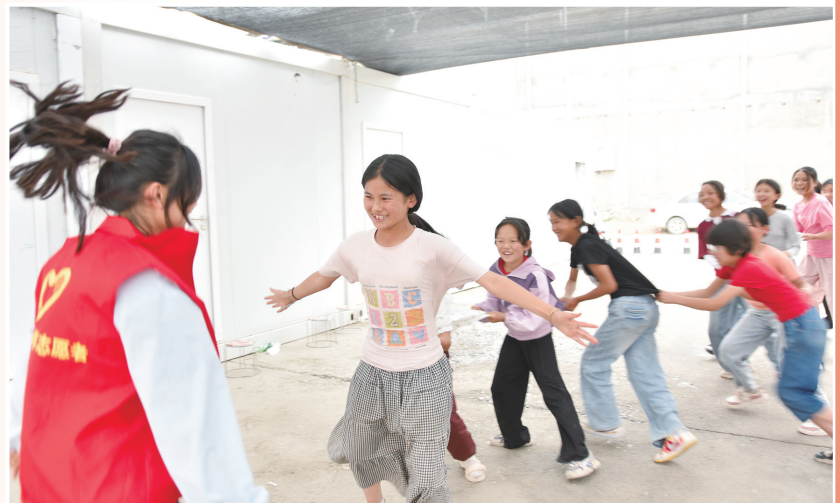
暑期社区公益托管班