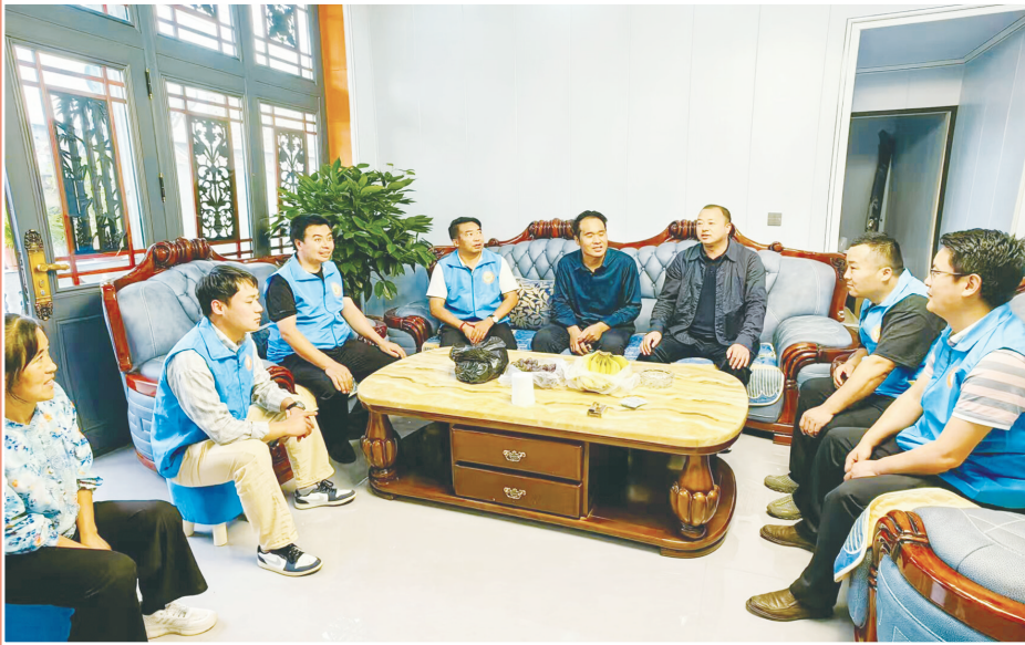
千群畅谈未来新生活