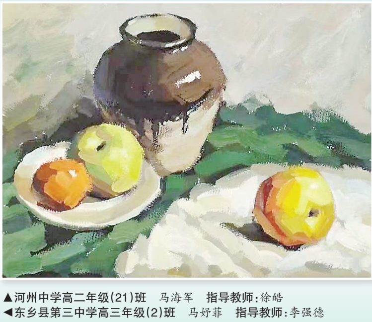
▲河州中学高二年级(21)班 马海军 指导教师:徐皓