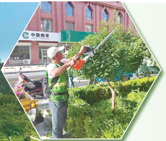
连日来,东乡县清除主要绿化带杂草,完成县城内重要节点乔木、灌木、地被草坪的修剪,推动绿色文明发展,创建宜居生态园林城市。