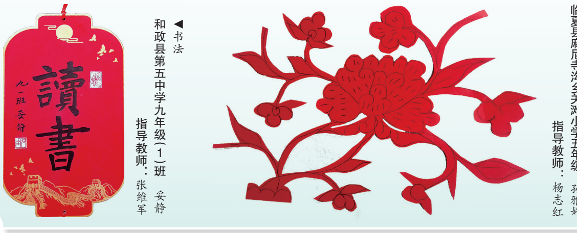
临夏县麻尼寺沟乡关滩小学五年级 孙雅婷 指导教师:杨志红