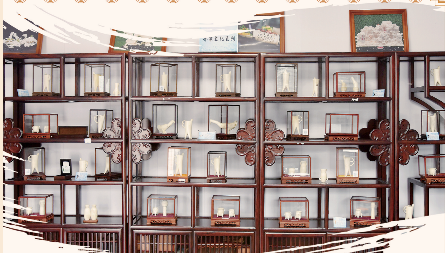
齐家文化系列骨雕作品展架