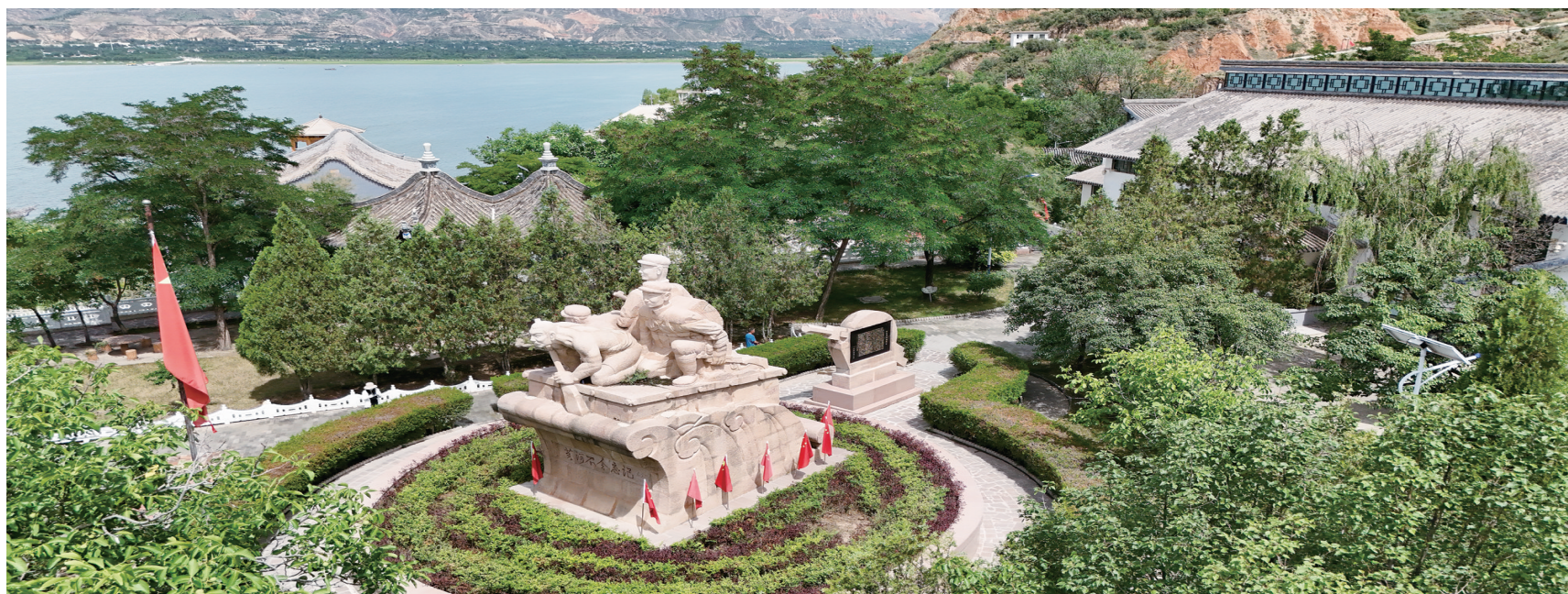
临夏县解放军抢渡黄河纪念馆