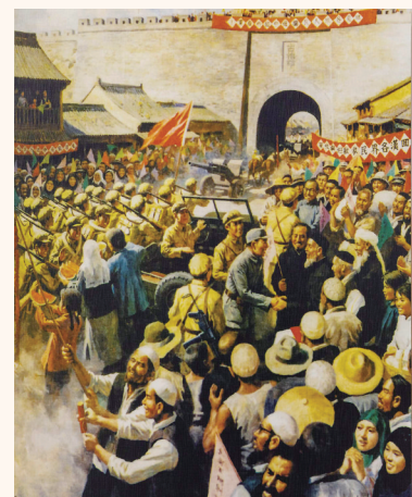
临夏各族群众欢迎人民解放军(油画)