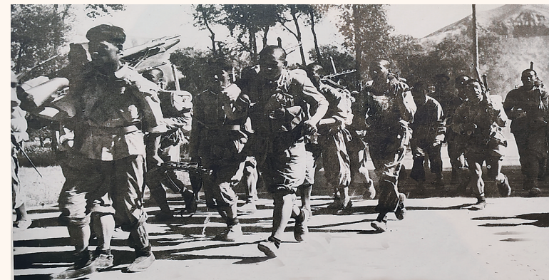
1949年8月23日下午,第二军解放永靖县城莲花城。