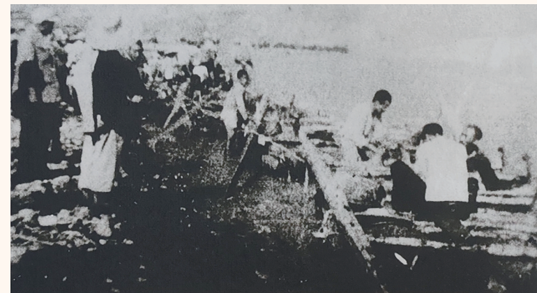
在当地群众帮助下,部队乘坐羊皮筏子渡河。