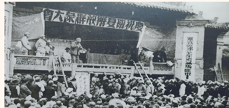
1949年8月25日,临夏各族群众集会庆祝解放。