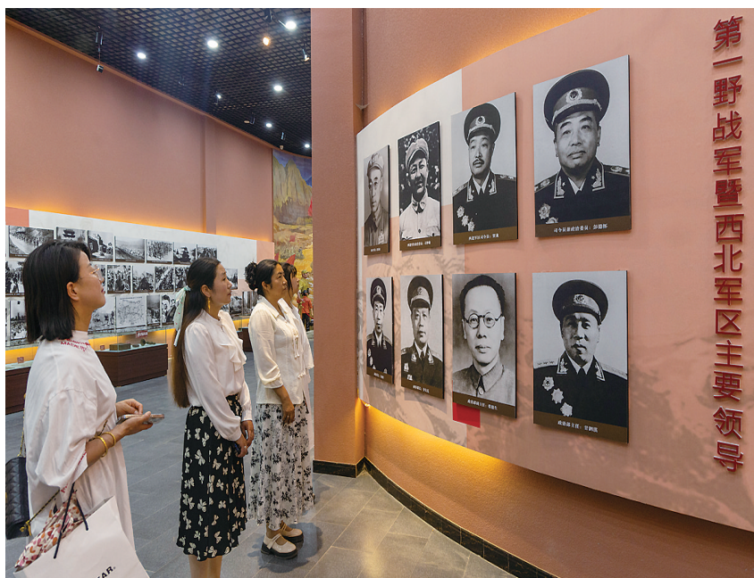
社会各界前来参观