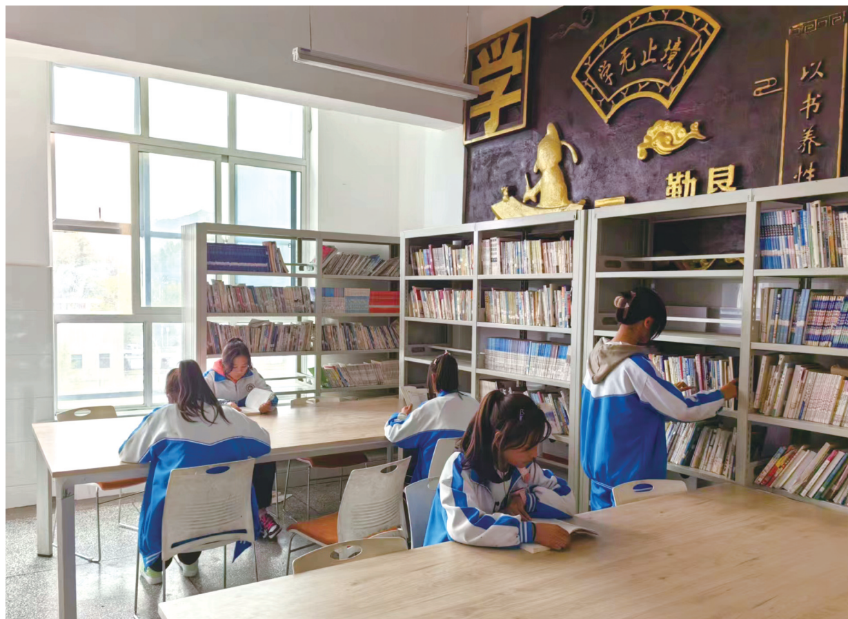
连日来，积石山县大河家中学利用课余时间，开展以“铸牢中华民族共同体意识”为主题的读书活动，丰富广大师生的内心世界，拓宽知识面，开阔视野。

州作协主席王维胜在序文《用文学追溯心路历程》中写道：《身心栖翔港湾梦》是一本诞生在河州大地上的书，从故园出发，触碰生活日常的肌理，文学的手抚摸过的每一个细节，呈现在纸上，变得温暖而又踏实、真诚又谦逊，熠熠生辉，照亮每一个人的灵魂。