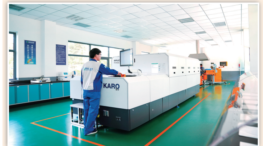
6月13日,工作人员在康辉新材料科技有限公司的功能性薄膜实验室内进行实验。位于营口仙人岛经济开发区的康辉新材料科技有限公司作为推动区域聚酯新材料产业强链、延链的“排头兵”,不断以新技术开发新产品,以新产品拓展新市场,持续为产业发展注入活力。近年来,辽宁省将发展新材料作为建设新型原材料基地的突破口,提高新材料在原材料工业的比重,形成新动能。