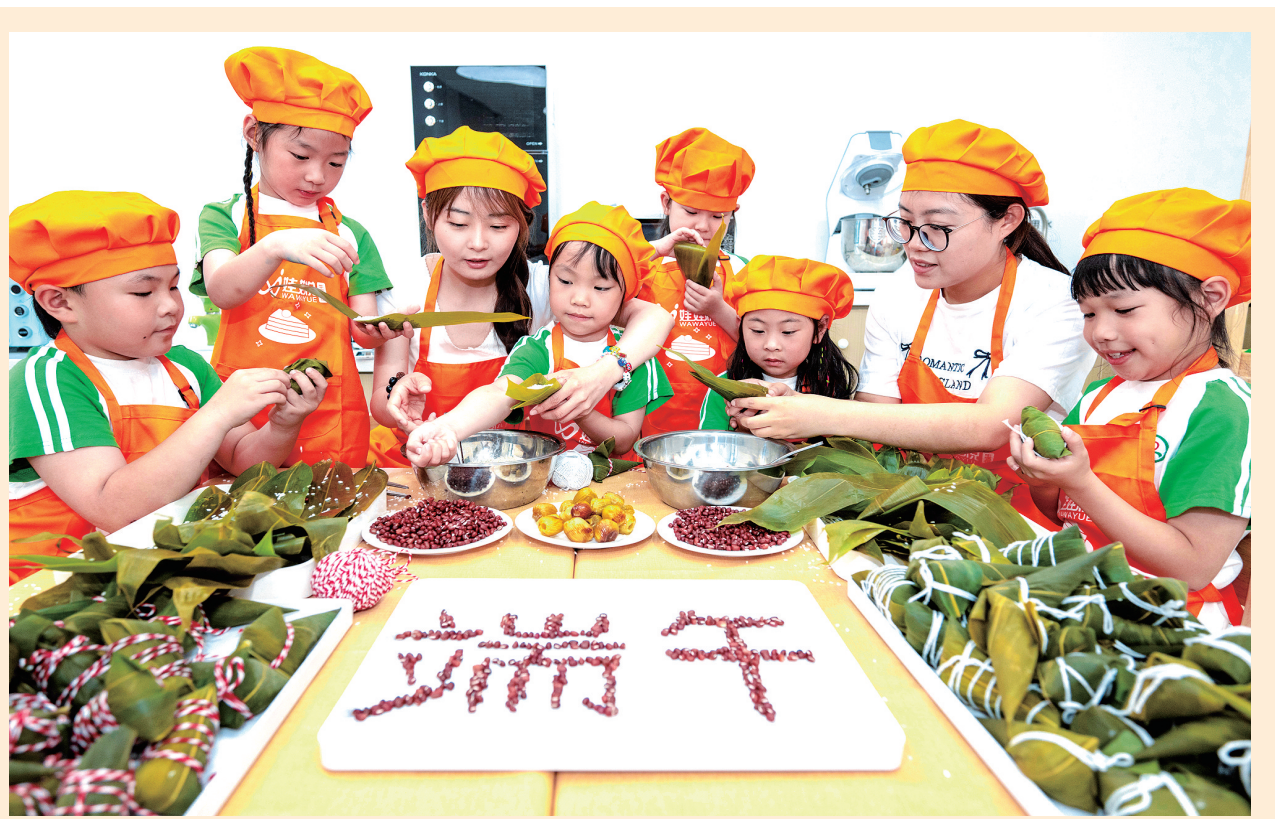
6月6日,在浙江省湖州市长兴县泗安镇中心幼儿园,孩子们在老师的指导下体验包粽子。端午节临近,各地举办多彩活动,迎接传统节日。