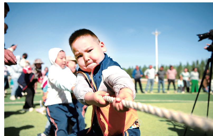
5月29日,在甘肃阿克塞哈萨克族自治县赛马场,小朋友们参加拔河比赛。“六一”国际儿童节即将到来,各地开展丰富多彩的庆祝活动。

通知要求,各地各部门要组织开展贴近儿童、活泼有趣、寓教于乐的庆祝活动,丰富儿童精神文化生活;聚焦心理健康、防网络沉迷、安全教育,线上线下集中推出家庭教育微课、举办家长课堂、开展育儿咨询,广泛普及家庭教育理念知识;通过举办模拟法庭、法院检察院开放日等活动,开展法治宣传教育,提高儿童自我保护意识和能力。