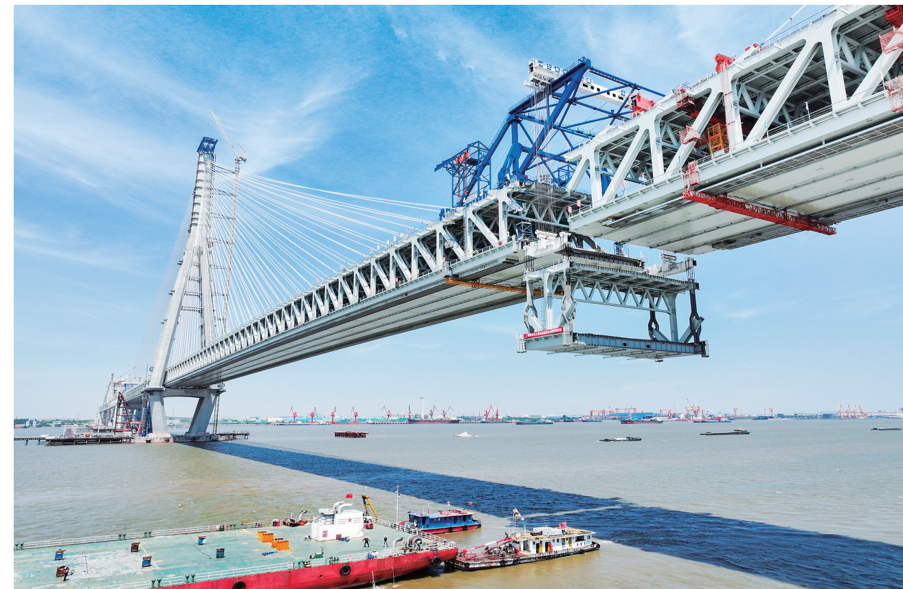
5月29日拍摄的常泰长江大桥主航道桥合龙段钢桁梁吊装现场(无人机照片)。当日,常泰长江大桥主航道桥最后一节钢桁梁——合龙段钢桁梁顺利吊装到位,拉开主桥合龙的序幕,预计6月上旬完成合龙,实现全桥贯通。常泰长江大桥连接江苏省的常州市与泰州市,是一座集高速公路、城际铁路、普通公路于一体的过江通道。