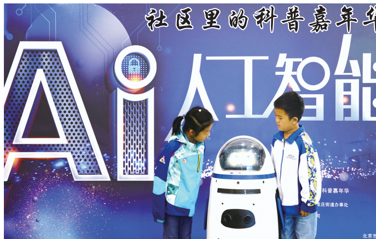
5月25日,孩子们在科普嘉年华活动中与机器人互动。在全国科技活动周期间,北京市朝阳区八里庄街道在日坛中学实验学校举办以“对话人工智能,探索未来之门”为主题的社区科普嘉年华活动,通过互动体验和科普讲座等多种形式,为社区居民和学生们展示人工智能技术的魅力。

新华社天津5月25日电(记者 张泽伟)由国家体育总局、中华全国体育总会主办的第一届全国全民健身大赛(华北区)25日在天津拉开帷幕。为期4个月的比赛预计将带动千万人参与全民健身活动。 第一届全国全民健身大赛(华北区)涉及北京市、天津市、河北省、山西省、内蒙古自治区。当天的开幕式在天津工业大学体育馆举行,佟文、魏秋月、汪浩、于萌萌、董洁等奥运冠军、全国冠军领唱《红旗飘飘》,将开幕式推向高潮。 本届赛事本着“全民参与、全民运动、全民健康”的办赛理念,综合考虑华北地区地域特色、项目普及度,采取“5+10+N”的方式设置项目,即足球、篮球、气排球、健身气功、太极拳5个规定项目,门球、广播体操、轮滑、乒乓球等10个自选项目,“N”个各省区市自行开展项目。