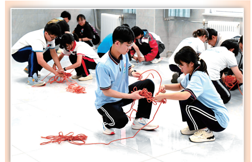
5月23日，学生参加软绳梯作项目竞赛。5月23日至24日，河北省石家庄市2024年中小学劳动技能竞赛在石家庄市国源小学举行。本次竞赛设置4个组别，包括技能、烹饪、生活、农耕4大类22个比赛项目，400名选手参赛。新华社发 陈其保 摄

“我们通过变温实验，首次在原子尺度上‘看到’冰表面预融化的过程，发现其在零下153摄氏度时就开始融化。”江颖说，这对理解冰面的润湿现象、云的形成及冰川的消融过程等至关重要。 中国科学院院士、轻元素平台理事长王恩哥表示，这项工作刷新了长期以来人们对冰表面结构和预融化机制的传统认知，为冰科学研究打开了新的原子尺度视角。 《自然》对该研究进行专题报道。多位审稿人评论称，团队对冰表面进行原子级成像是重要的技术创新，所获得的分辨率在冰表面成像中“前所未有”，这些发现可能对大气科学、材料科学等多个领域产生深远影响。