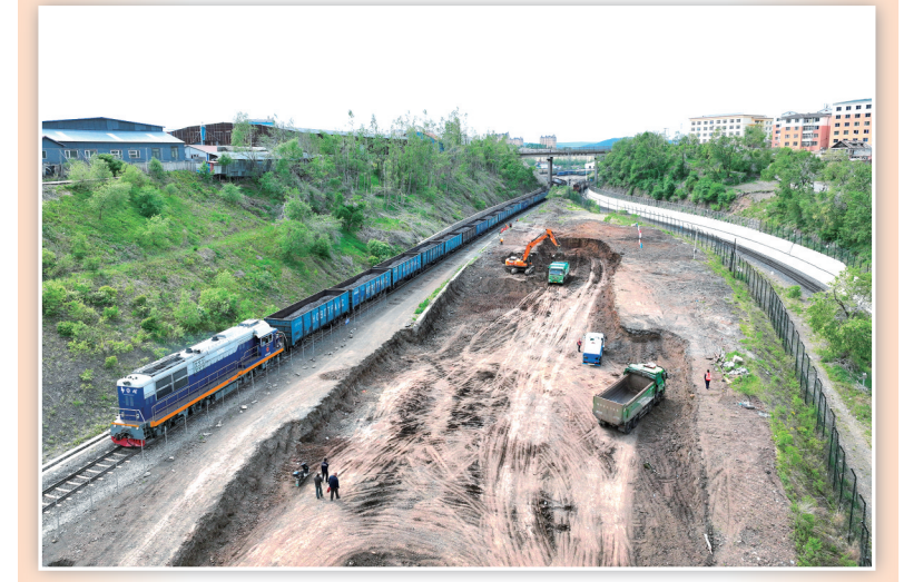
5月23日拍摄的滨绥铁路绥芬河至国境线改造工程现场(无人机照片)。当日，由中铁第五勘察设计院设计、中铁六局集团公司施工建设的滨绥铁路绥芬河至国境线改造工程正式开工。工程位于黑龙江省绥芬河境内，既有线路的列车运行时速仅为55公里，改建后设计时速120公里，线路通过能力提升一倍以上。工程有望于2025年年底竣工。滨绥铁路起点为哈尔滨，终点为中俄边境城市绥芬河。绥芬河是我国中欧班列“东通道”重要的通行口岸，铁路口岸年货物发送量超1000万吨，中欧班列年通行量近900列，运送货物达8.8万标箱。