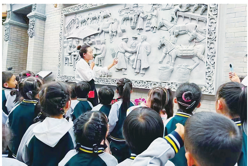
近日,临夏市金果果幼儿园在八坊十三巷开展研学活动,让孩子们近距离体验家乡文化瑰宝、感受传统艺术魅力。

相信随着园区的进一步建设,将会为我州发展民族特色食品产业带来全新的机遇和市场。打造民族特色食品产业链系统,为全球市场提供产品服务,让临夏的民族特色食品走向世界,让“河州味道”香飘四海。