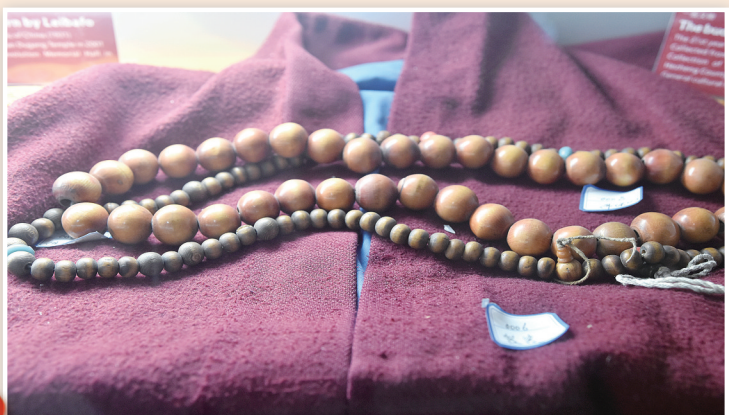
肋巴佛的僧衣与佛珠