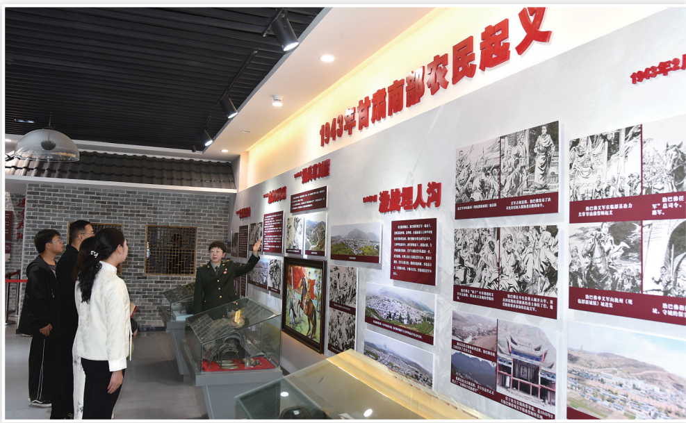
社会各界前来参观,接受革命教育

被共青团临夏州委命名为“临夏州青少年爱国主义教育基地”;2014年7月,被中共甘肃省委宣传部、武警甘肃省总队政治部联合命名为“武警甘肃省总队红色教育基地”;2015年7月,被甘肃省博物馆协会命名为第一批文化遗产“历史再现工程·博物馆”;2021年5月,被临夏州委、州政府命名为“铸牢中华民族共同体意识教育基地”;2023年4月,被中共临夏州委宣传部命名为“临夏州精神文明单位”;5月,被中共甘肃省委、和政县人民政府命名为“铸牢中华民族共同体意识教育基地”;被临夏州新时代文明实践中心命名为临夏州第一批“新时代文明实践基地”;2023年5月30日,由甘肃省委教育工委、省委宣传部等11个部门授予甘肃省“大思政课”实践教学基地;2023年9月27日,被甘肃省社会科学联合会命名为第四批“甘肃省社会科学普及示范基地”等。