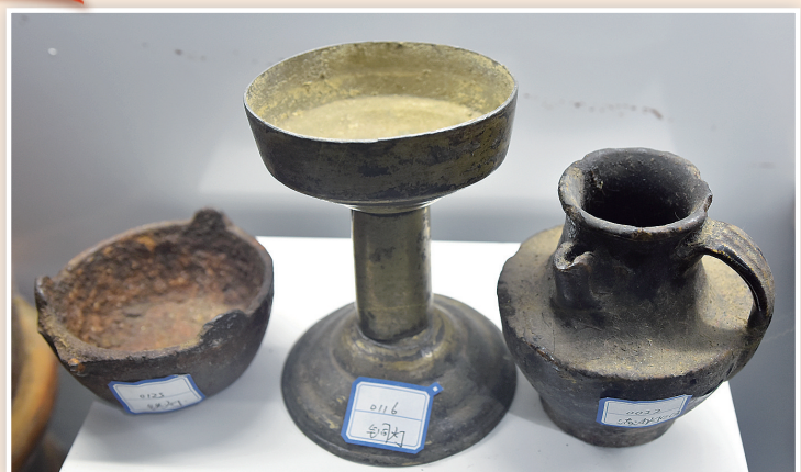
肋巴佛使用过的铜灯