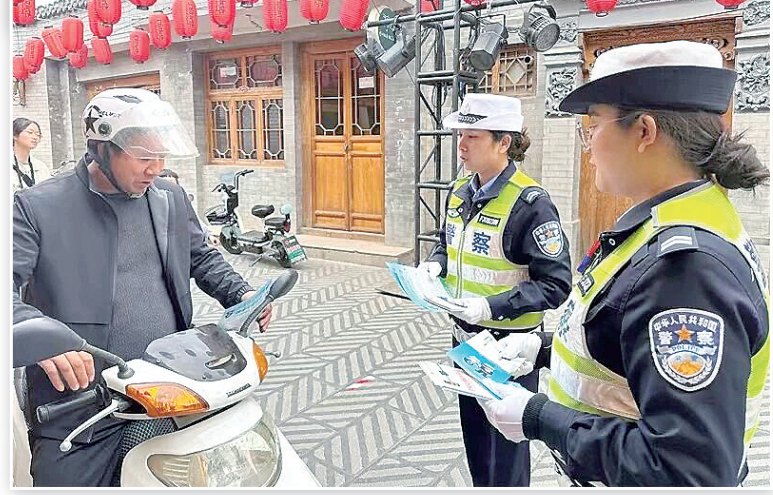
连日来,为护航旅游经济发展,临夏市公安局创新警务模式,推动警力前置,不断提升服务质效,真正做到用脚步换来游客平安、用汗水换来游客满意、用用心换来游客口碑。