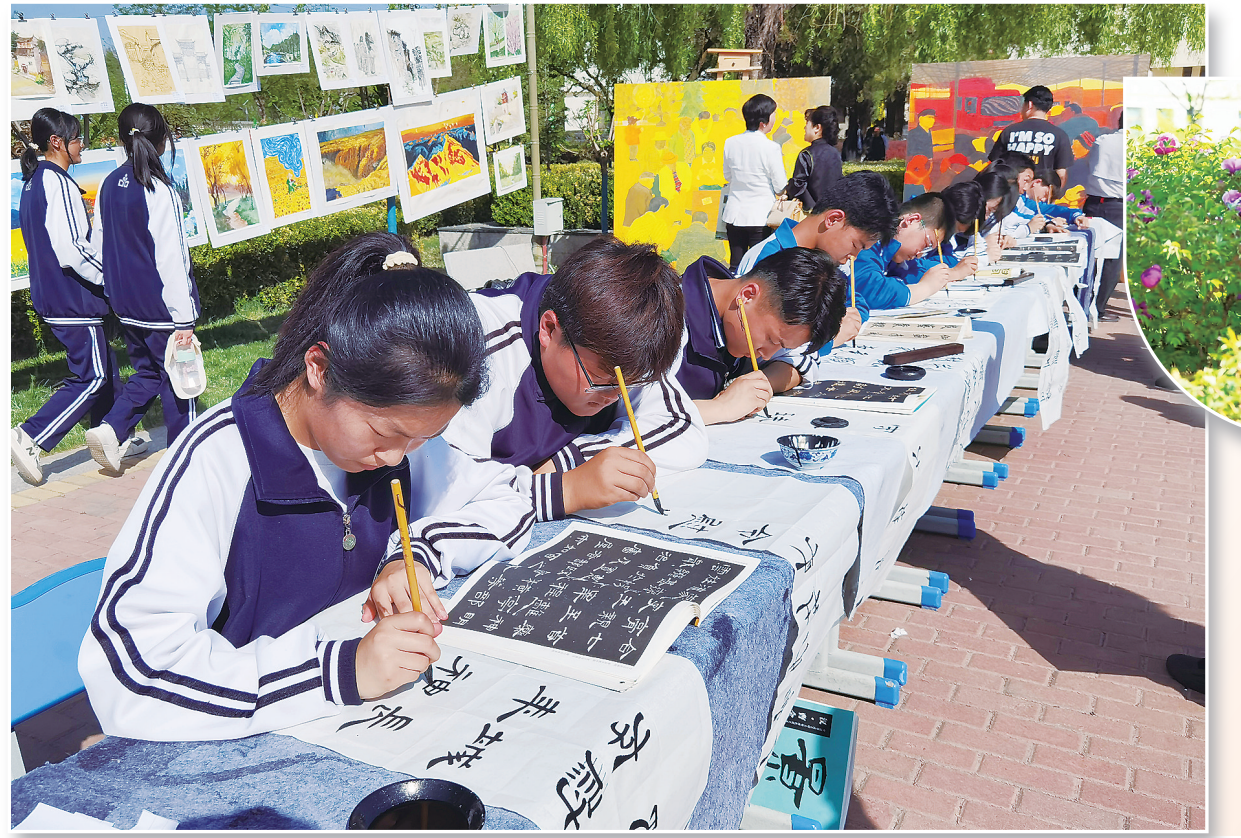
5月9日,临夏回民中学第四届牡丹文化艺术节拉开帷幕。“画牡丹”“书牡丹”“唱牡丹”“展牡丹”等一系列活动,为学生搭建展示才华、张扬个性、放飞梦想的艺术平台。