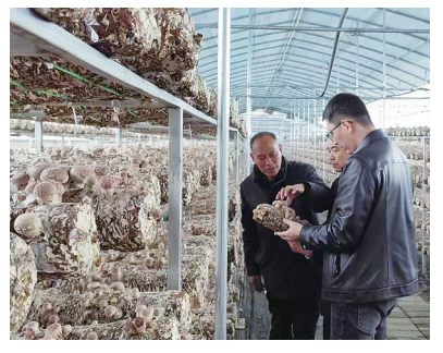
五月暖风,万物生长。位于康乐县八松乡新庄、魏寨两村交界处的富康食用菌种植基地大棚里的香菇丰收在望。一袋袋菌棒在钢架上整齐排列,阵阵菌香扑鼻而来,一朵朵香菇脚足了劲儿生长,承载着菇农增收的希望。

香菇有“百菇之王”的美誉,味道鲜美、营养丰富,备受市场青睐。据了解,经过基地加工的香菇鲜品主要销往四川、重庆、宁夏等地,产业效益有保障,成为振兴乡村的助推器。