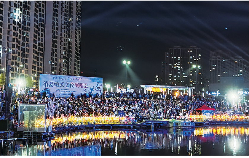
连日来,2024河州牡丹文化嘉年华系列活动仍在持续中,游客沉浸式畅游临夏,感受花儿临夏独特韵味和别样风采。图为在临夏市黄河国家文化公园举办的消夏纳凉之夜演唱会。

据悉,此次牡丹文化书画交流展,为期20多天,共展出100多幅作品,7月初,入展作品还将移至古都洛阳进行展出,两地市民将一睹艺术瑰宝的风采。