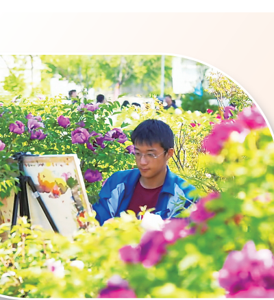
5月9日,临夏回民中学第四届牡丹文化艺术节拉开帷幕。“画牡丹”“书牡丹”“唱牡丹”“展牡丹”等一系列活动,为学生搭建展示才华、张扬个性、放飞梦想的艺术平台。