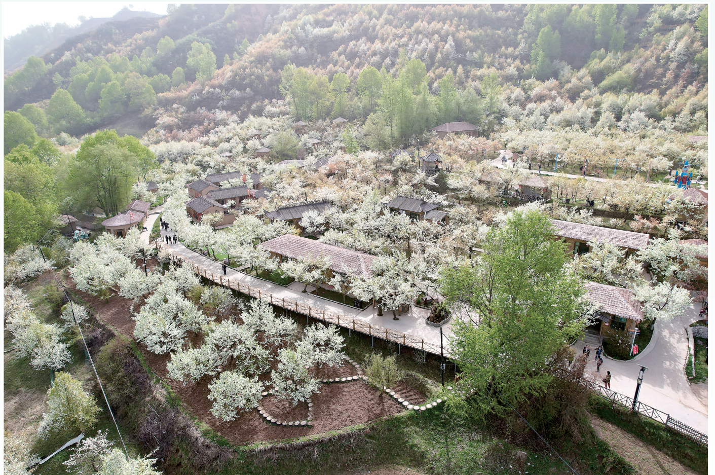
掩映在花海的梨园山庄